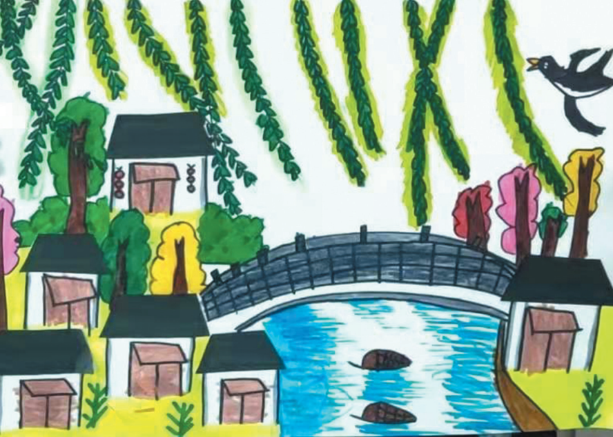
作者:淮南市山南新区淮师附小第十六小学一(7)班 方墨染 指导老师:杨梅