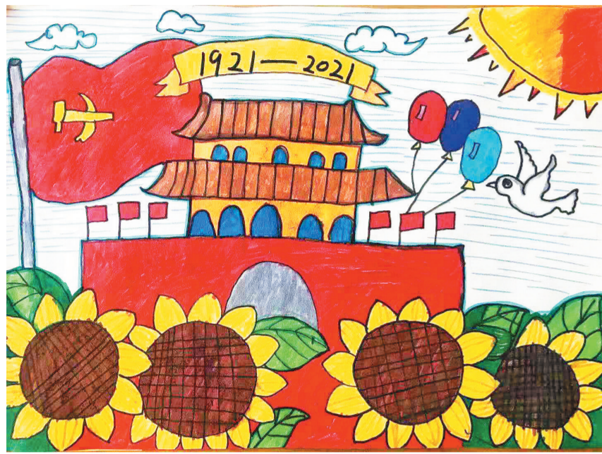
我爱北京天安门 作者：长丰县实验小学二(3)班 水欣月

是夜。书桌前，我翻开一书。浮云吹作雪，世味煮成茶。没什么比此刻更好了，我已陶醉在诗词中