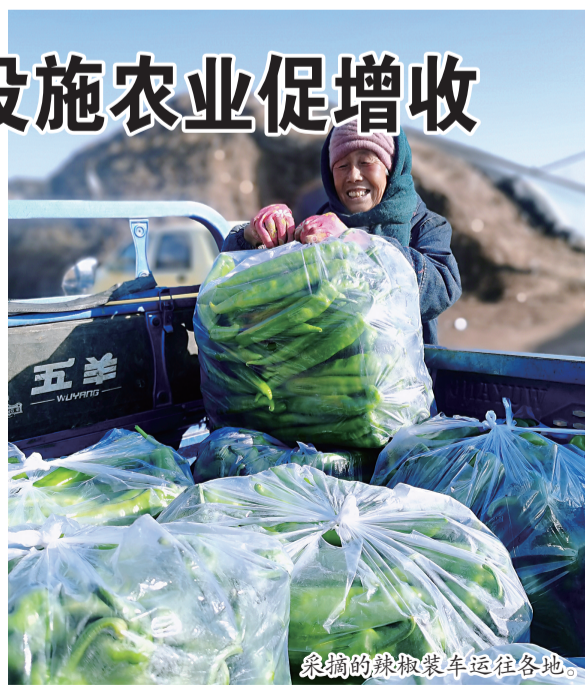
采摘的辣椒装车运往各地。

近年来,大营子乡大力发展设施农业,今年计划争取资金2000余万元,用于建设高标准冷棚350栋,带动周边村民务工150余人,年劳务收入200余万元。