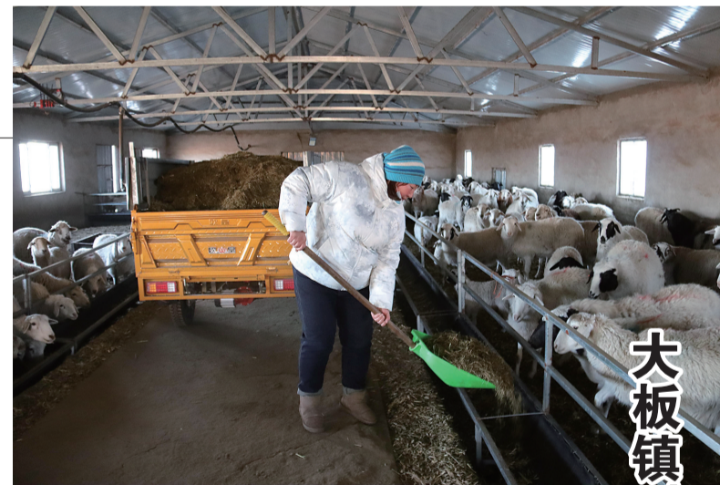
牧民为母羊添加饲料。

下一步,元宝山区市场监管局将继续结合日常监管和专项整治行动,持续开展燃气、醇基燃料使用的常态化检查工作,对使用燃气、醇基燃料的餐饮服务单位、洗浴等重点场所进行重点监管,进一步落实安全主体责任,保障群众生命财产安全。