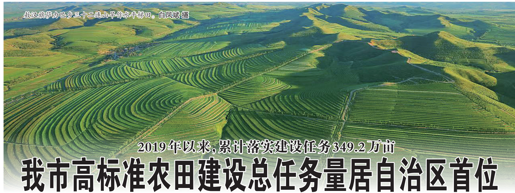
敖汉旗伊力巴乡三十三连山旱作水平梯田。

自治区农牧厅、自治区财政厅、自治区农发行有关负责同志,12个盟市农牧局有关负责同志及松山区主要负责同志参加会议。