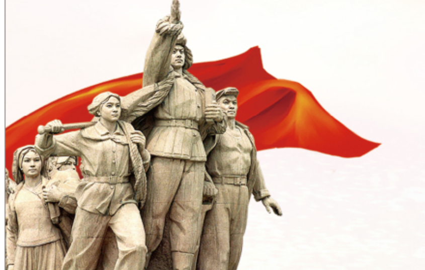
革命战争时期的战士雕塑。

调,要认清形势,充分认识开展正风肃纪专项行动的重要性和紧迫性,吃透精神,深刻把握正风肃纪专项行动的着力点,健全机制,切实加强专项行动的组织领导和推进实施。作风建设只有起点,没有终点,只有更好,没有最好,只有常抓常新,没有一劳永逸。他激励医院全体干部职工要以此次正风肃纪专项行动为契机,以更加严明的纪律、更加过硬的作风、更加务实的举措,全力营造人民医院风清气正的政治生态,为携手迈进社会主义现代化建设新征程提供高质量健康保障。 聚力量,真抓实干把会议精神转化为务实行动。院长柏正群在总结发言中表示,通过这次动员活动,希