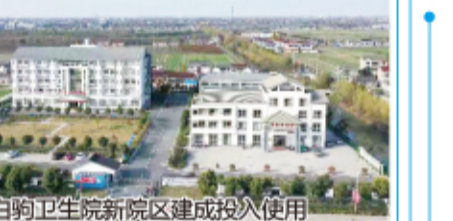
白驹卫生院新院区建成投入使用