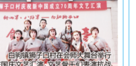
狮子口村庆祝新中国成立70周年文艺汇演