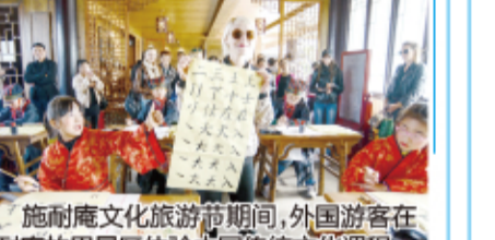
施耐庵文化旅游节期间,外国游客在施耐庵故里景区体验中国传统文化课程