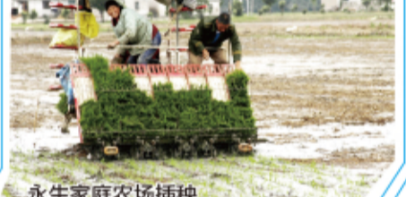
永生家庭农场插秧