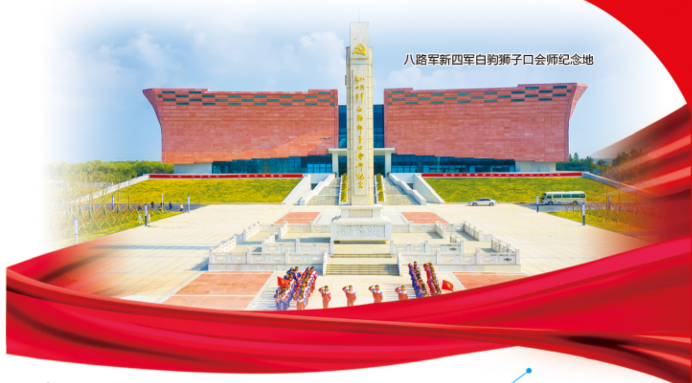
八路军新四军白驹狮子口会师纪念地