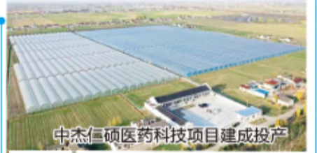
中杰仁硕医药科技项目建成投产