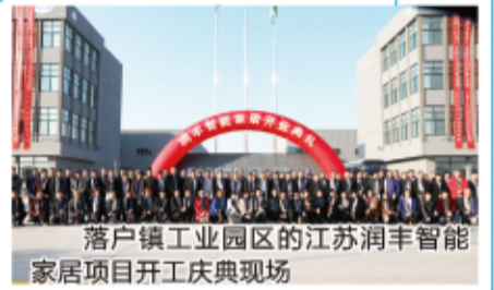
落户镇工业园区的江苏润丰智能家居项目开工庆典现场

凡是过往,皆为序章;凡是未来,皆有可期。白驹镇党委、政府将带领全镇党员干部更加紧密地团结在以习近平总书记为核心的党中央周围,在省市区委的坚强领导下,抢抓机遇、开拓创新,振奋精神、砥砺前行,实现“十四五”良好开局,全面建设镇强民富水美的现代化新白驹,以乡村振兴高质量发展丰硕成果庆祝中国共产党百年华诞!