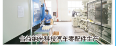
合益纳米科技汽车零部件生产