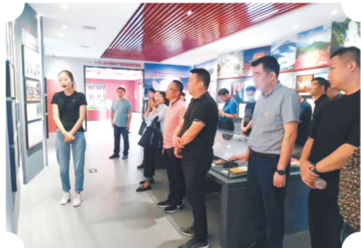
开展观摩学习活动