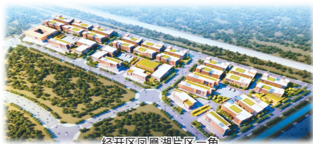
经开区凤凰湖片区一角