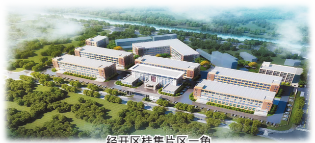
经开区桂集片区一角