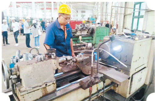
园区繁忙的生产场景