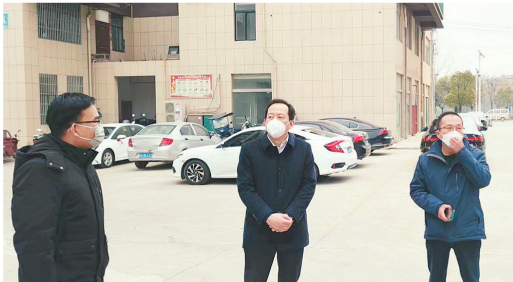
经开区主要负责同志深入企业调研