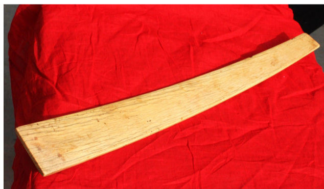
董令矩上朝所用象牙笏版