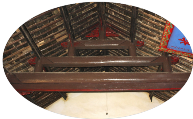
董令矩创建的董氏家祠内重梁起架