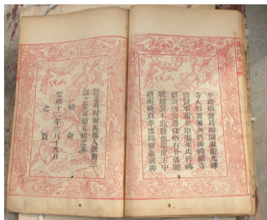
光绪董氏谱所载崇祯十二年颁给董令矩圣旨文