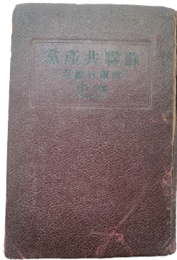
1939年出版的苏联共产党(波尔什维克)历史简要读本