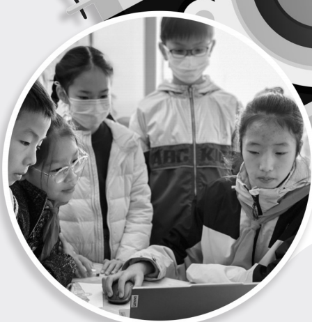
图片均为“校长小助理”工作照。

参加行政会议，听课，撰写工作日志，制作汇报课件——这些老师的“专工作”，常熟市实验小学的“校长小助理”们干起来照样不含糊。这不，这群小助理们正趁岁末年初，向全校师生做年终“述职”。