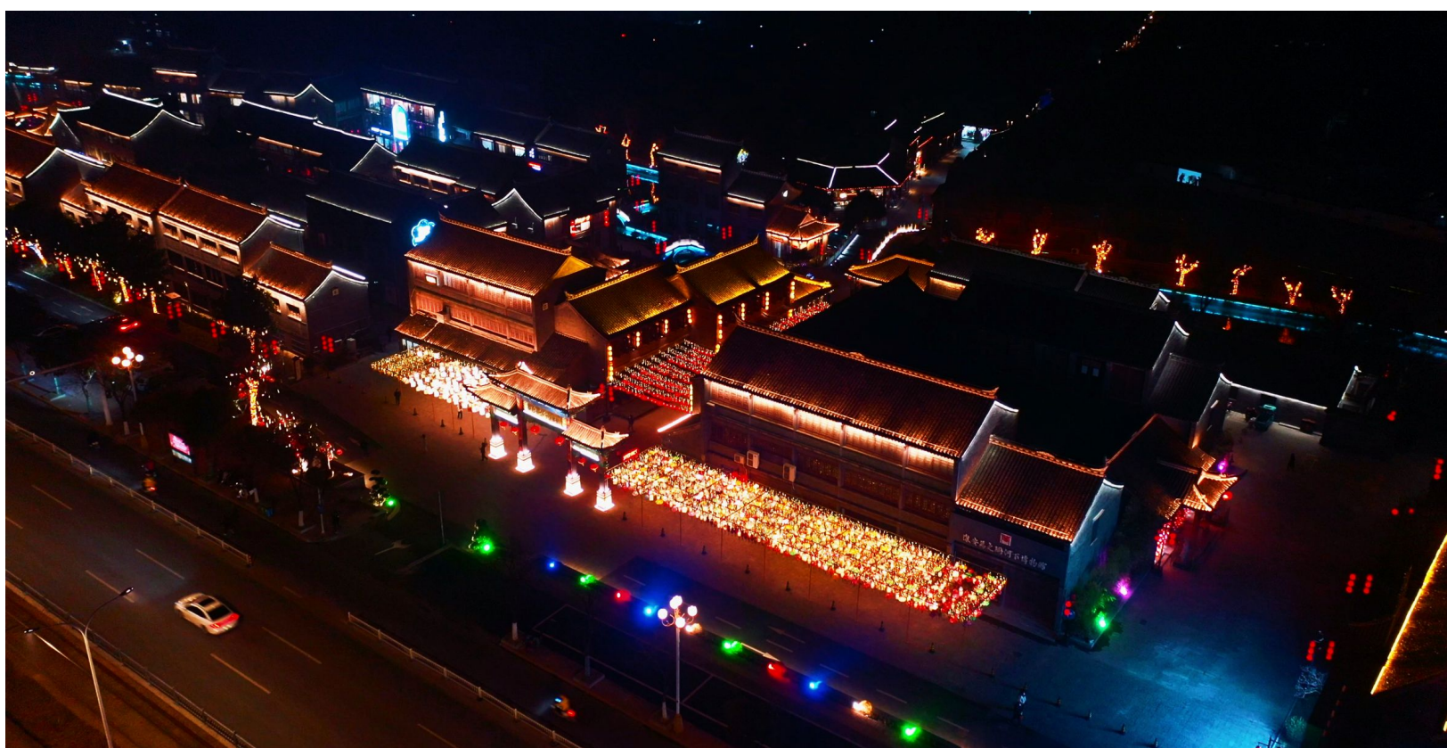
古镇夜景