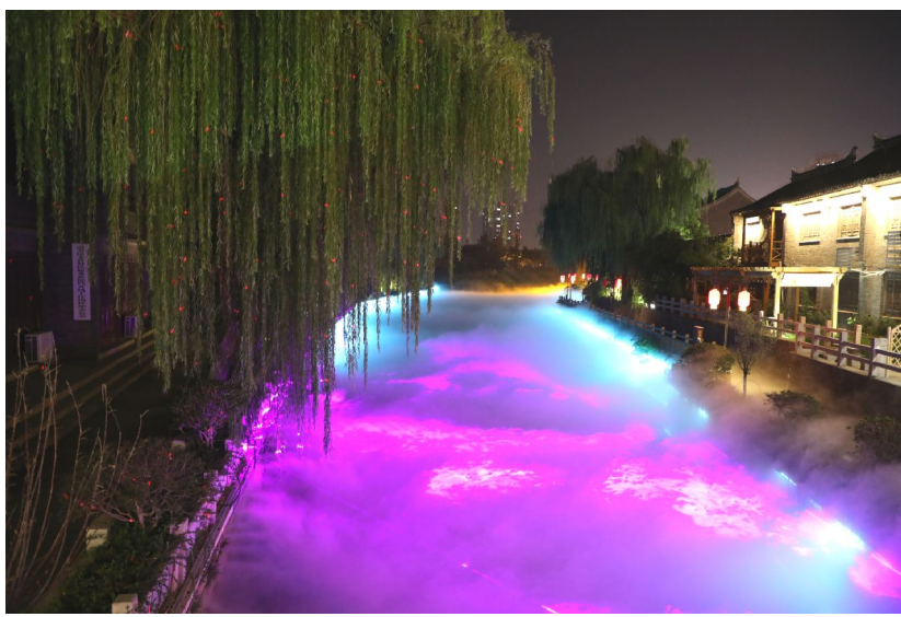
一池氤氲 千年河下