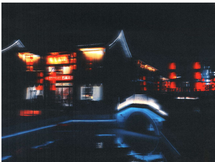
小桥流水