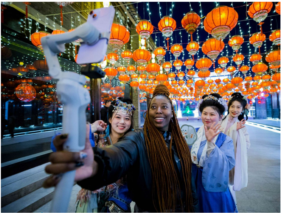
打卡河下