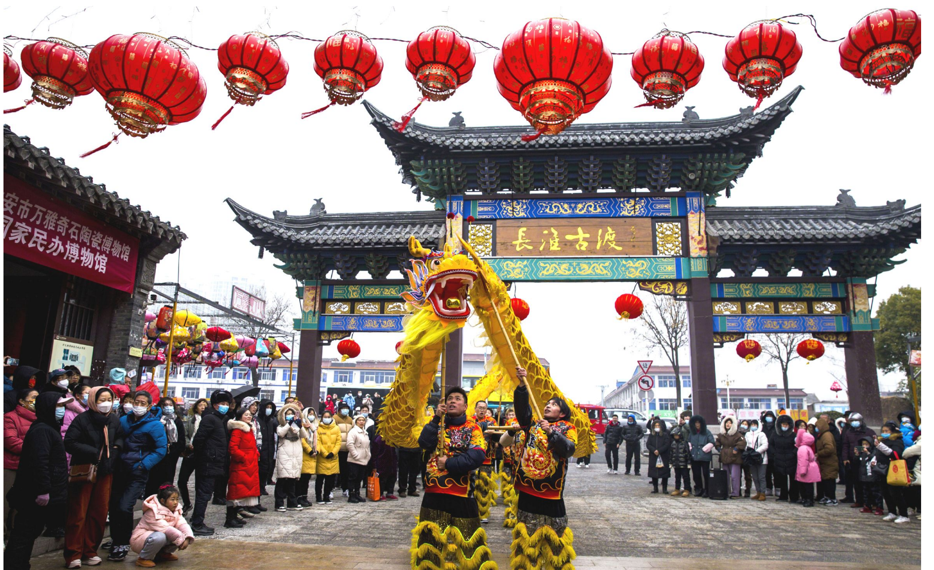
龙舞古渡

日前,区融媒体中心开展“春到河下”融媒体新闻行动,探访河下名人名著,名景名园,名店名菜……一同感受这座千年古镇春天的律动。