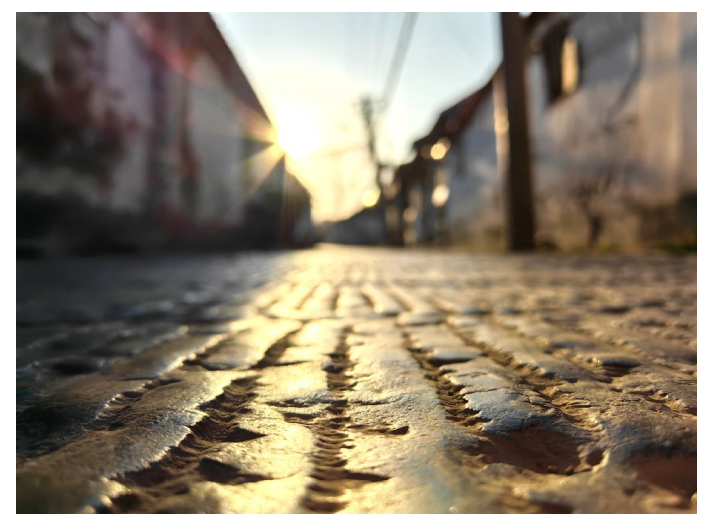
老街余晖