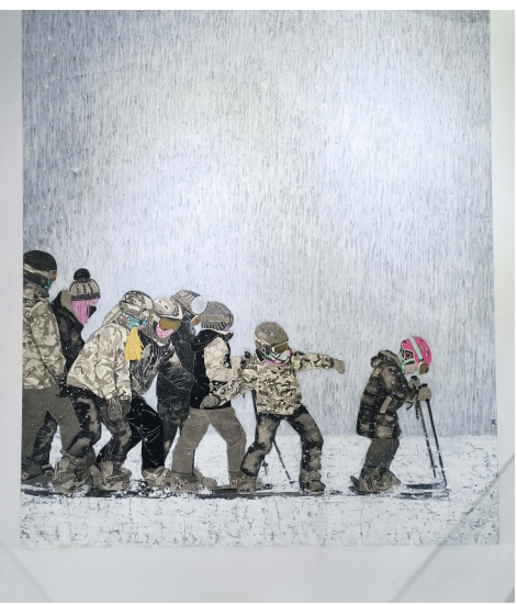
那年冬天 赵茉莉 作

选择医生这个职业我们牺牲了周末的休闲时光我们舍弃了假日的浪漫旅程值班 加班一次次与病魔搏斗人道 博爱 奉献是我们恪守的精神尊重生命 救死扶伤是我们肩负的使命今天我 我要告诉所有人天使来自人间