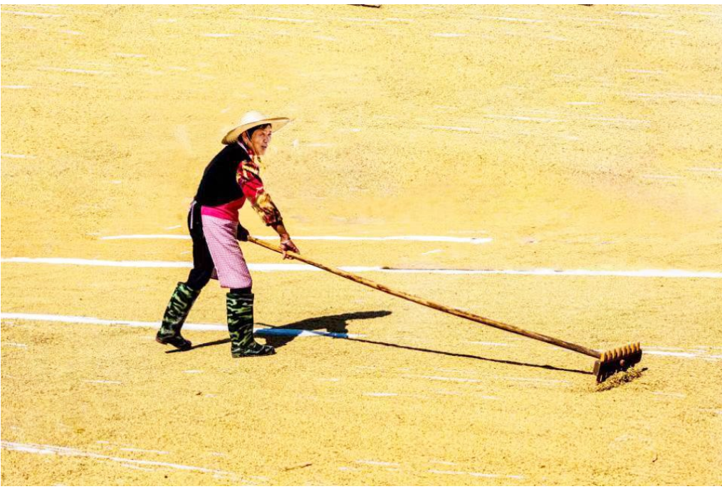
丰收之秋