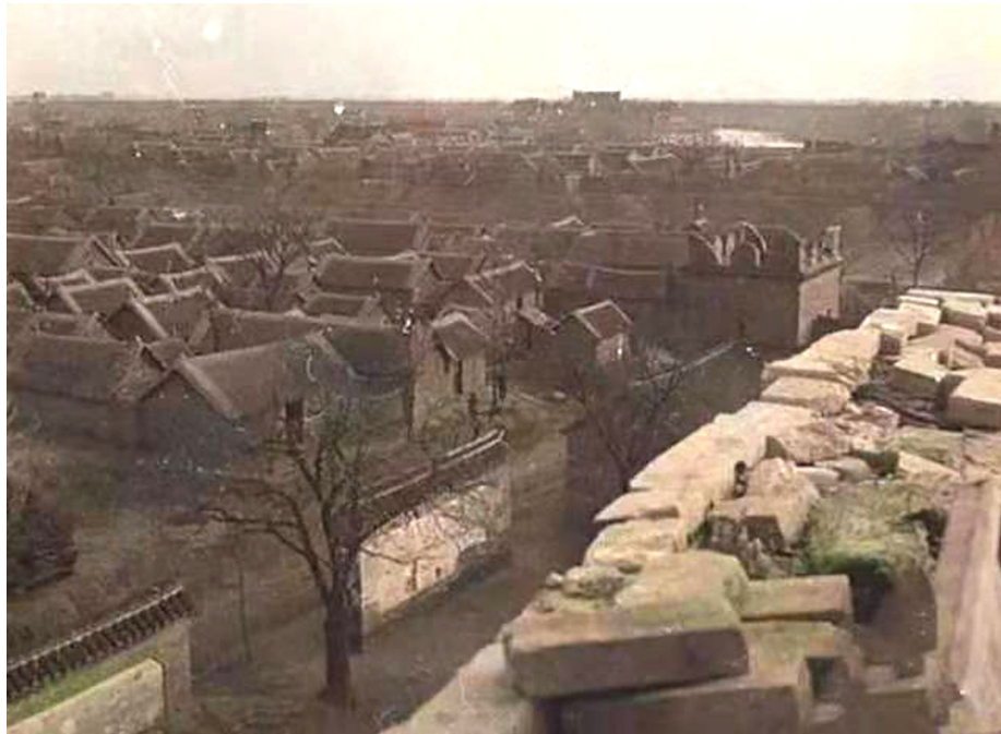
明清时期东门大街远景