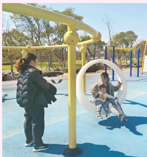
市民在东洲公园游玩