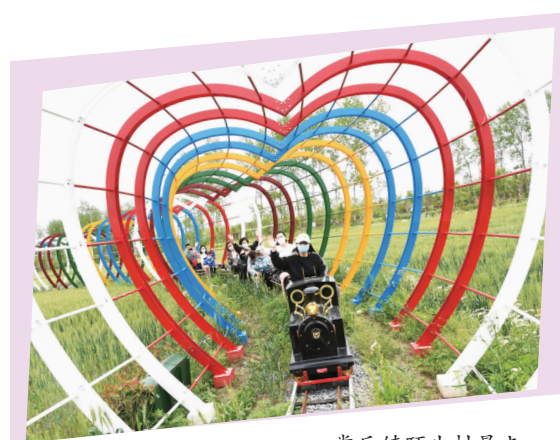
常乐镇颐生村景点