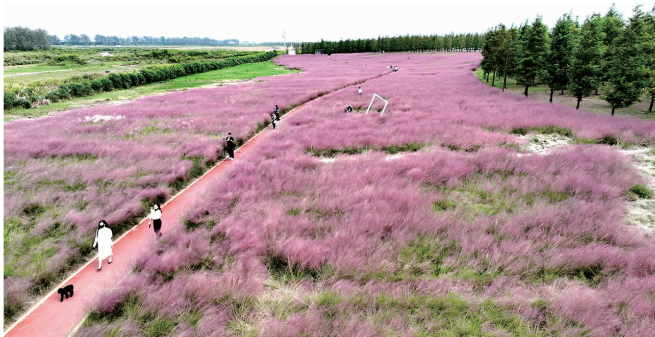
东布洲滩公园内的粉黛子吸引了不少游客打卡留影