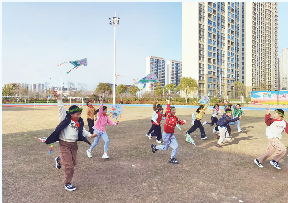
记者施春晓 通讯员蔡燕妮

近日，海门街道嘉陵江社区新时代文明实践站、关工委走进新教育小学云溪中队，开展“童绘春趣，拥抱春天”活动，让孩子们尽享春日乐趣。