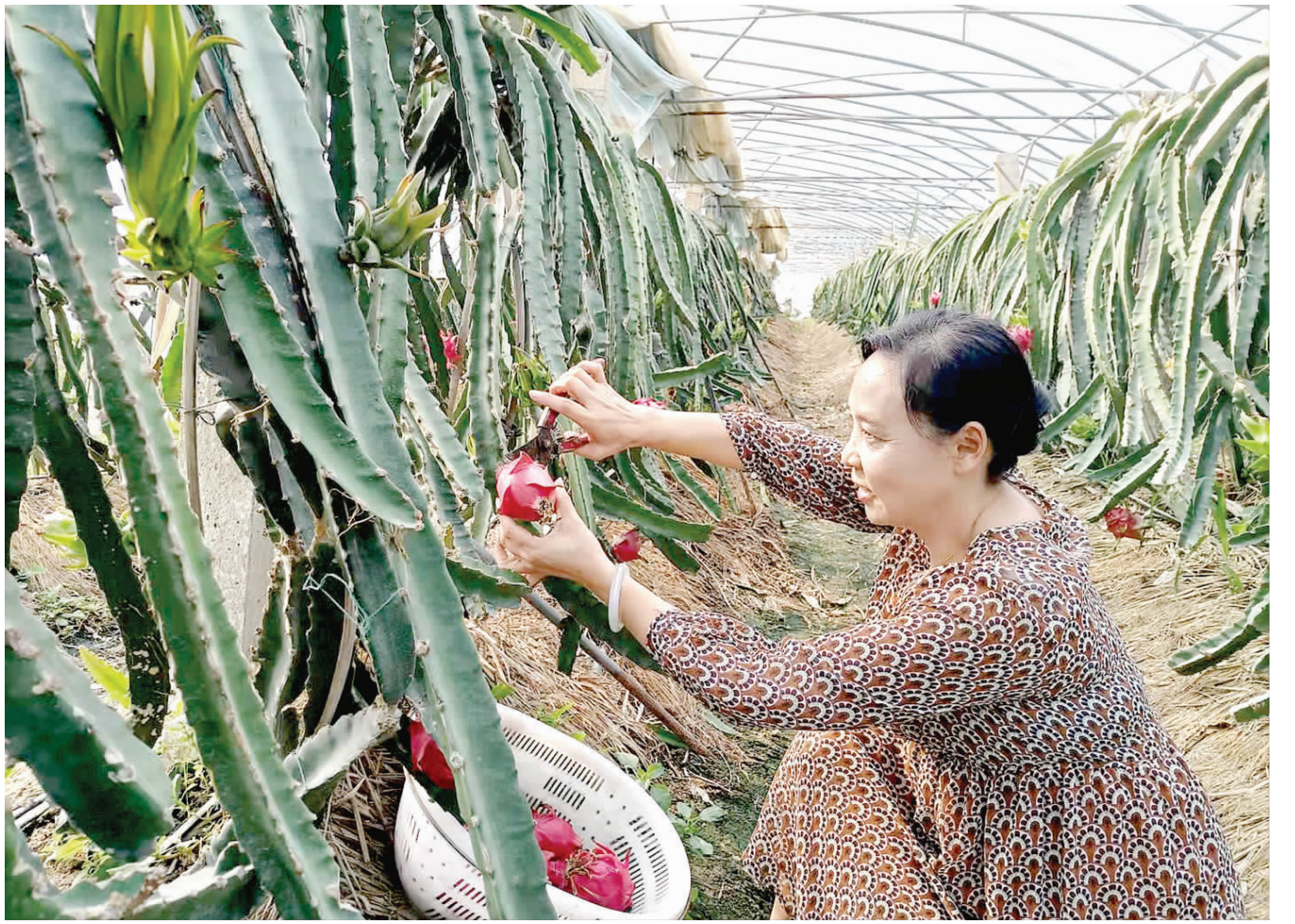
9月22日，市民在刘老庄镇香飘飘生态采摘园里采摘火龙果。眼下，该园种植的火龙果陆续进入成熟采摘期，吸引不少市民游客前往体验采摘乐趣。 融媒体记者 刘须连 通讯员 史公海

近年来，全区上下紧紧围绕法治政府建设要求，积极开展法治政府建设“补短板、强弱项”专项活动、法治政府建设情况全面检视活动，全面推进依法行政，规范履行政府职能，健全完善制度体系，科学民主依法决策，严格文明公正执法，强化权力制约监督，为统筹推进疫情防控和经济社会发展、全面落实“六稳”“六保”任务营造了良好的法治环境。