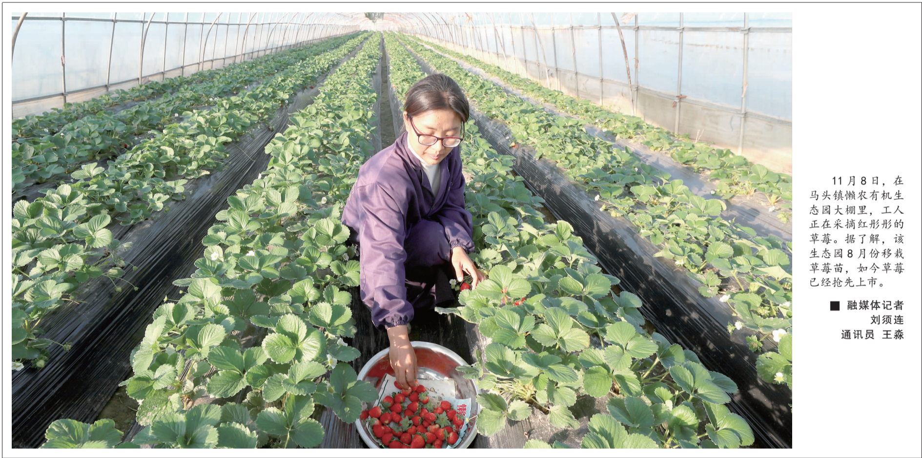
11月8日，在马头镇懒农有机生态园大棚里，工人正在采摘红彤彤的草莓。据了解，该生态园8月份移栽草莓苗，如今草莓已经抢先上市。