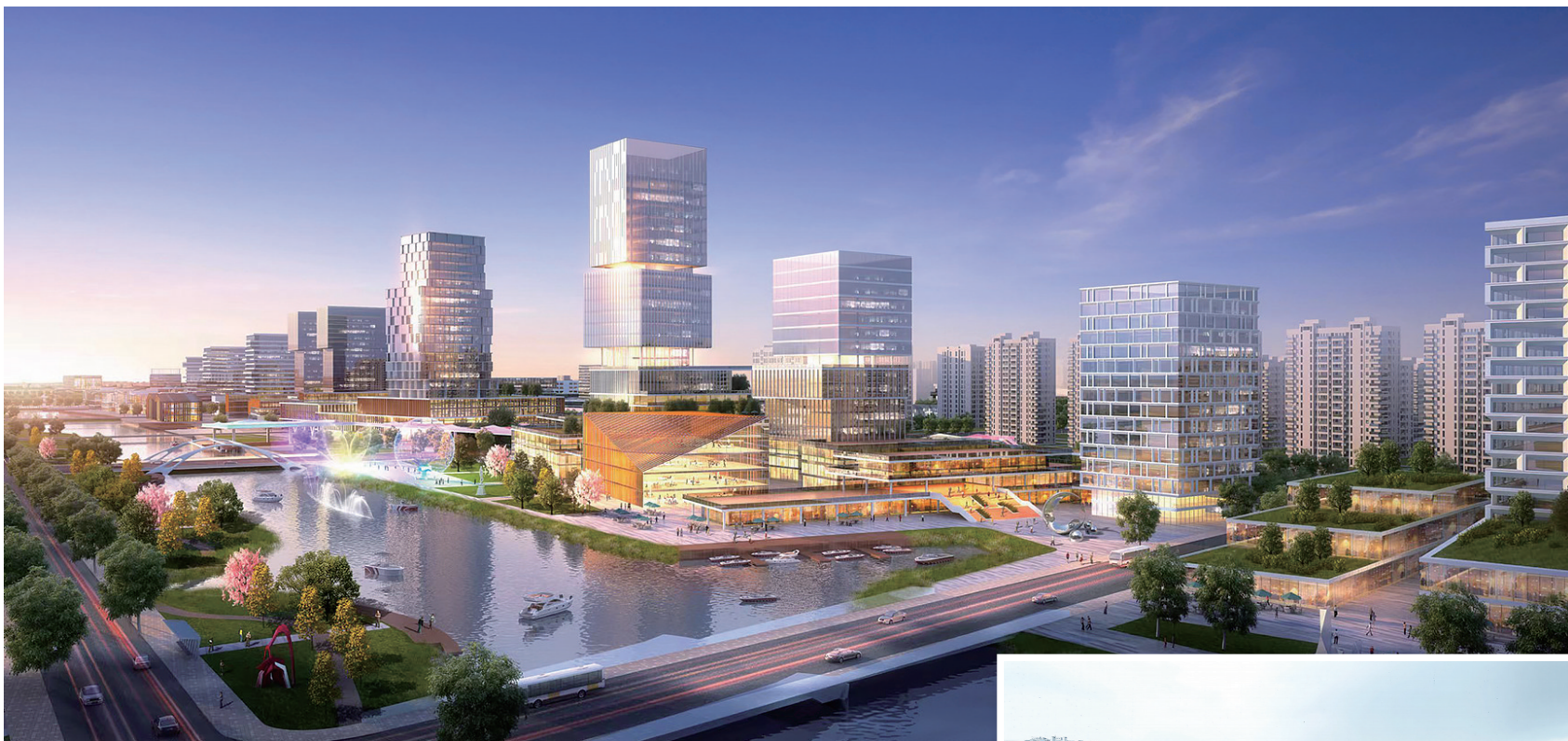
“联影小镇”将成为名副其实的“生产、生活、生态”三生融合的优质产业社区。图为“联影小镇”效果图。