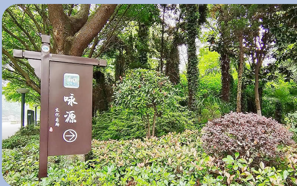
图 郁兴 严光华 长江