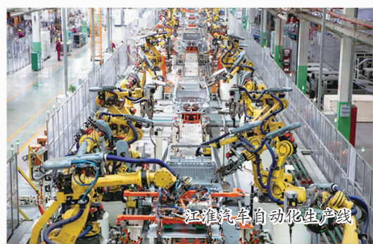
江淮汽车自动化生产线