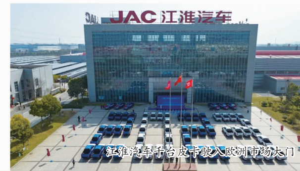
江淮汽车平台皮卡驶入欧洲市场大门