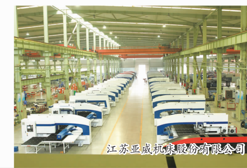
江苏亚威机床股份有限公司