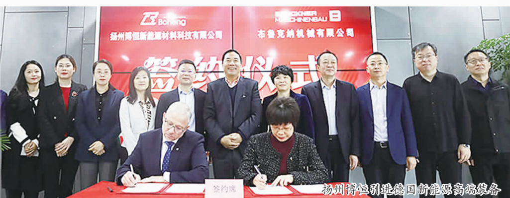
扬州博恒引进德国新能源高端装备