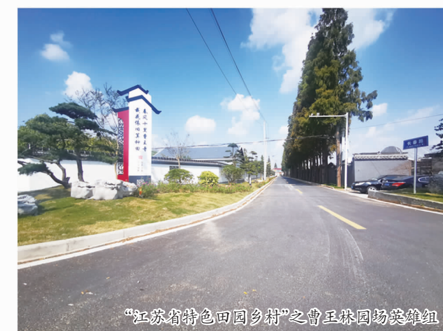
“江苏省特色田园乡村”之曹王镇园场菜篮子