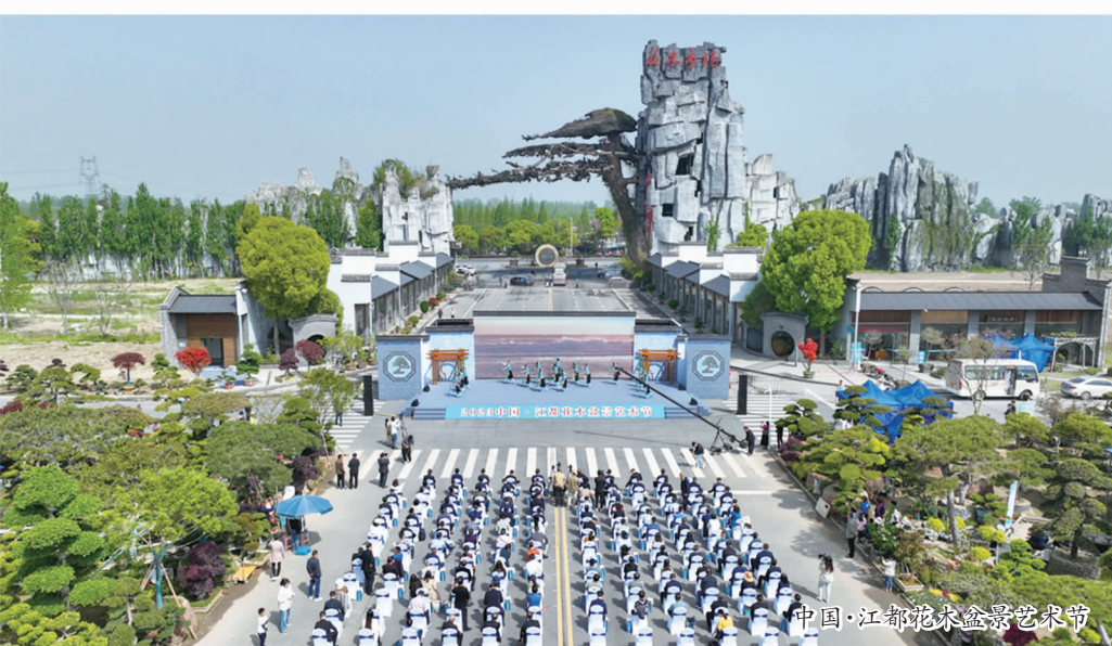
中国·江都龙水盆景艺术节