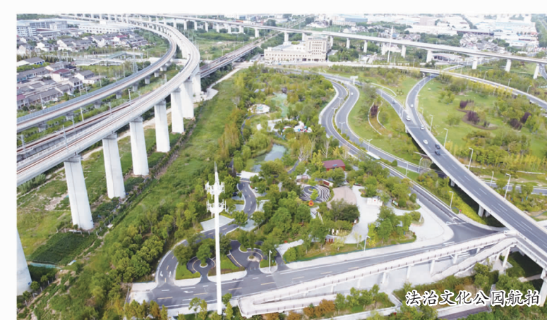
法治文化公园航拍