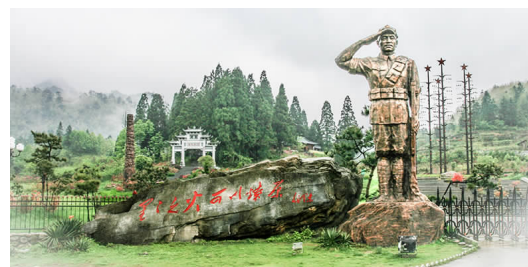
庆祝中国共产党成立100周年 红色足迹 22