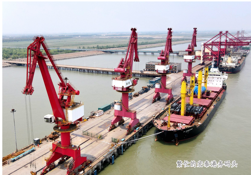
繁忙的宏泰港务码头