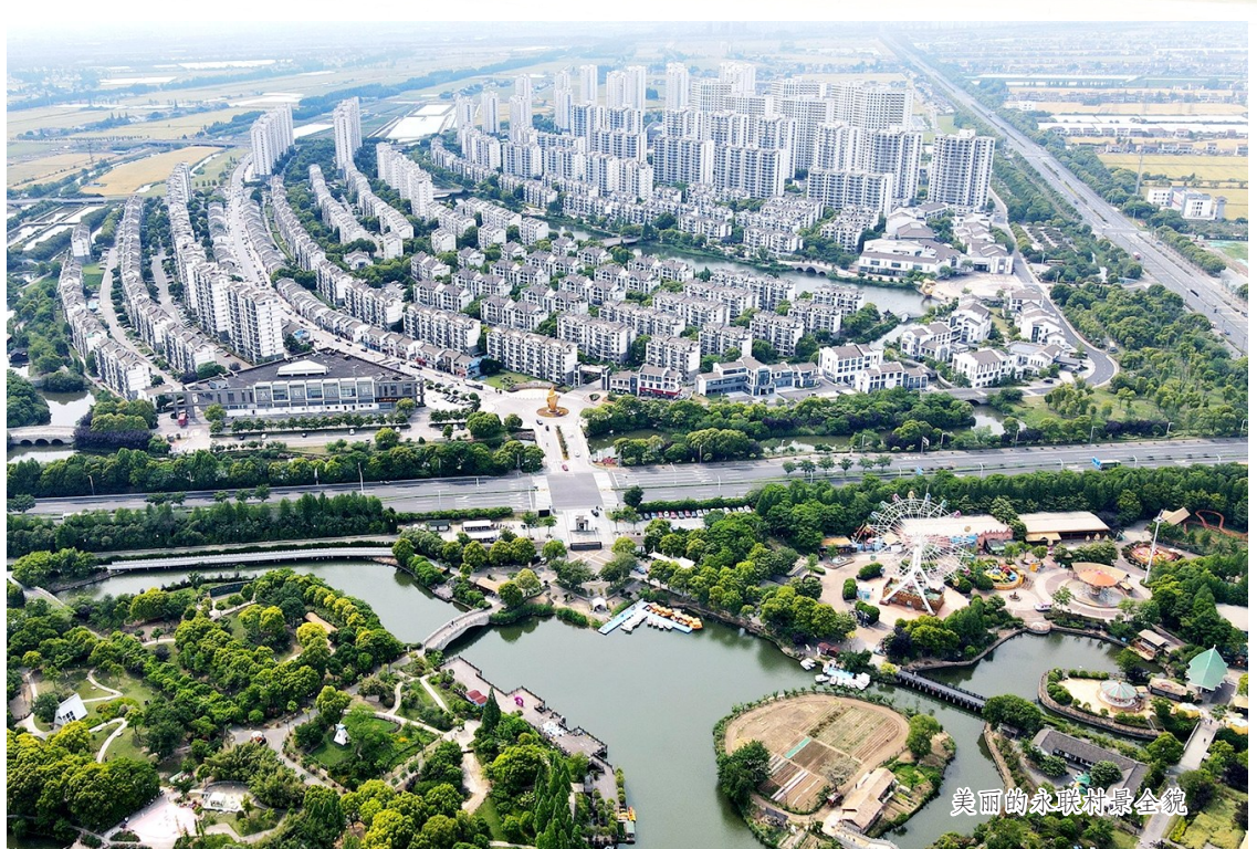
美丽的永联村生态园