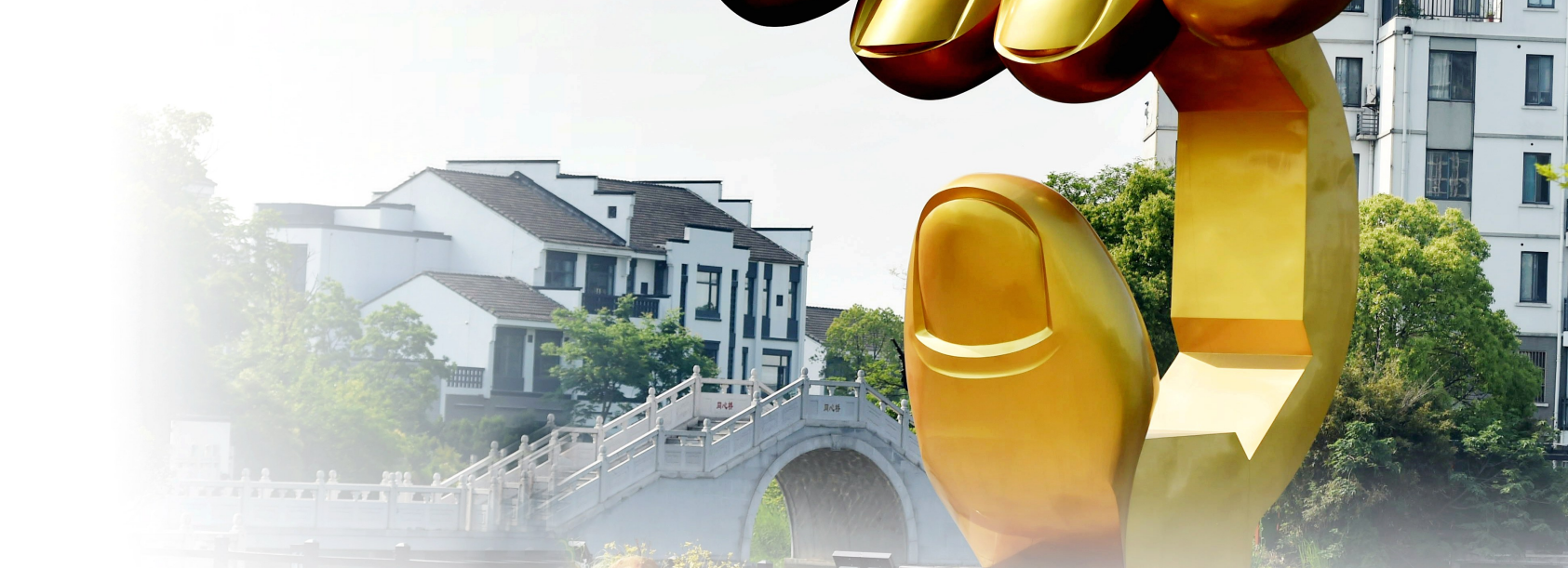
永联村金手指广场