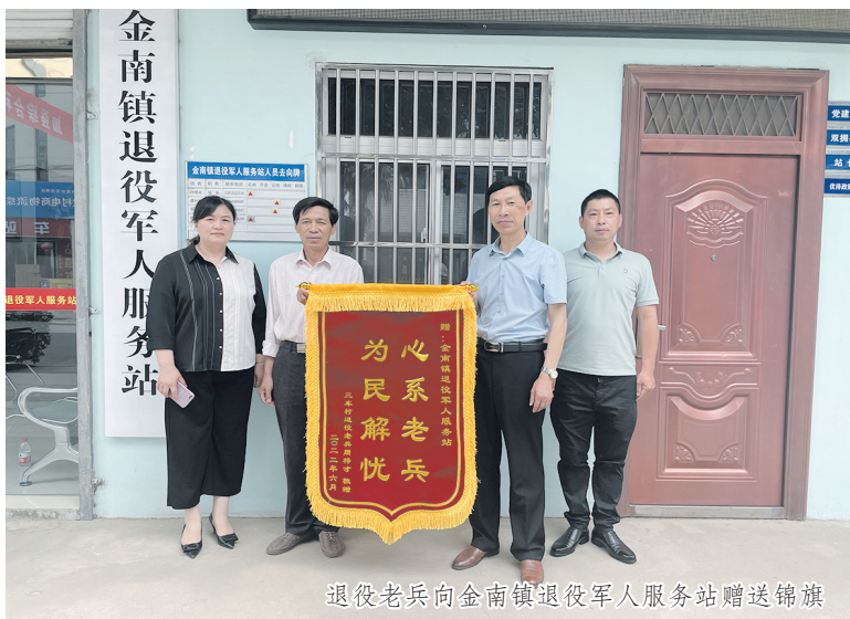
退役老兵向金南镇退役军人服务站赠送锦旗

金南镇辖区有退役军人及其他优抚对象927人，其中重点优抚对象206人。金南镇退役军人服务站自2019年5月挂牌成立以来，聚力为退役军人服务，通过落实落细相关政策，提升退役军人服务保障水平，增强退役军人的获得感幸福感，同时利用红色金南人民兵展示馆阵地为退役军人开展爱国主义教育红色教育，为退役军人搭建志愿服务平台，让他们时刻保持退伍不褪色建功新时代的精神风貌。