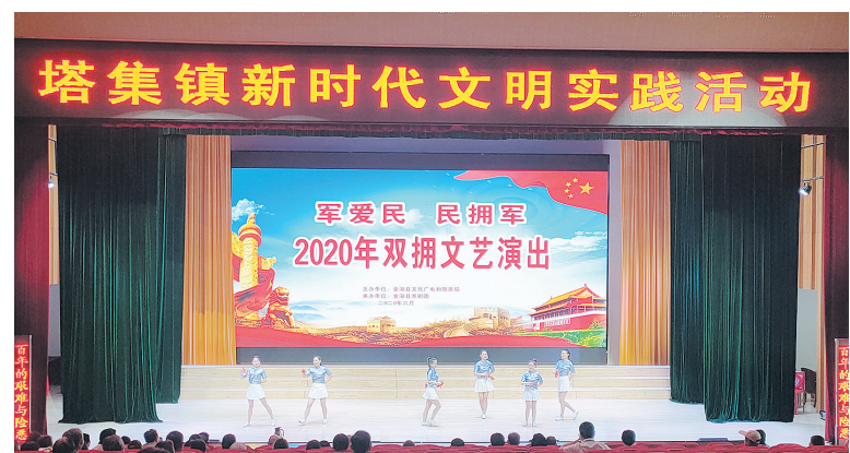
开展“军爱民 民拥军”为主题的新时代文明实践活动

五年来，塔集镇始终把握双拥创建工作贯穿到经济建设和国防建设全过程，不断开创军民团结新局面，更好服务党和政府工作大局，国防和军队建设全局。广泛开展国防和双拥宣传教育，通过LED显示屏、横幅等方式加强国防知识和双拥工作的宣传，增强广大人民群众国防意识和爱国主义意识。为立功受奖的现役军人家庭送上喜报。每年春节、“八一”期间走访慰问驻金部队、重点优抚对象，进一步弘扬我镇拥军优属的优良传统，体现党和政府对优抚对象的关怀之情。