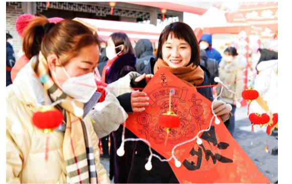
市民在逛非遗大集。

00。免费线路涵盖全部10条常规城市公交线路。为让免费活动家喻户晓、深入人心,该公司还印制暖心小卡片,注明免费活动的时段和线路,附注新年贺语。同时,通过公众号友情提醒广大乘客,配合做好疫情防控工作,自觉全程佩戴口罩,做好自己健康的第一责任人,全力营造文明乘车、欢乐出行的氛围。