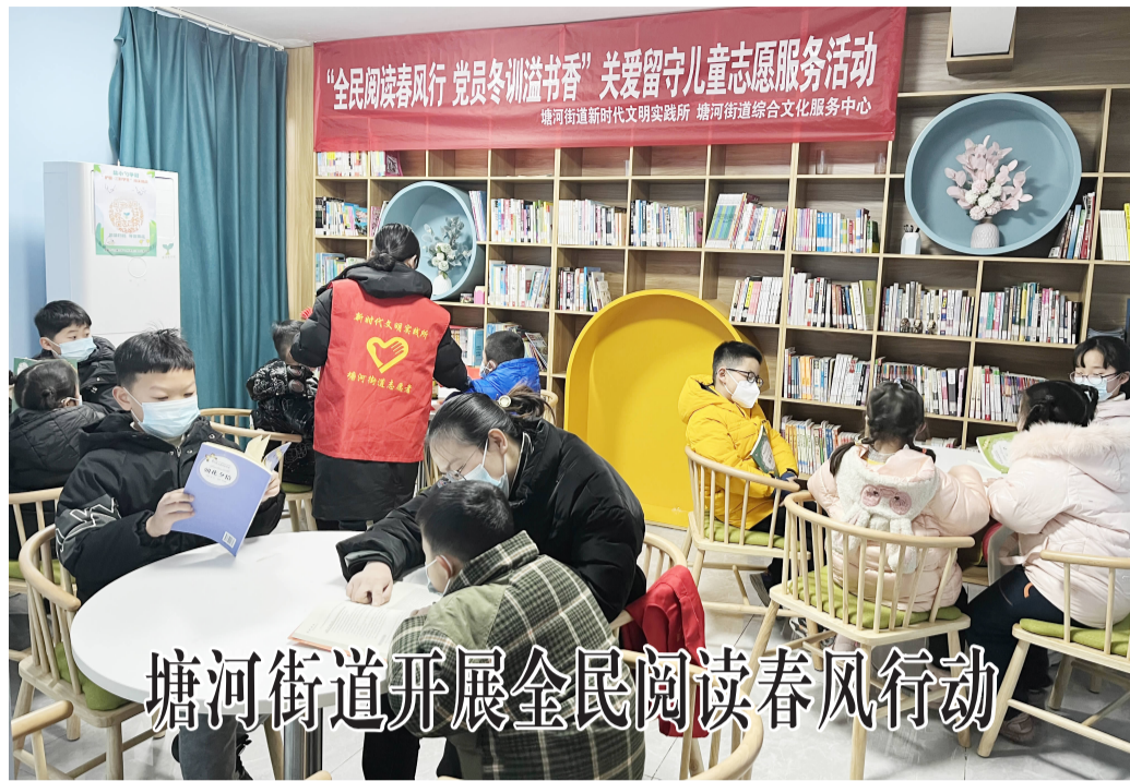
塘河街道开展全民阅读春风行动

本报讯 1月18日,在塘河街道新时代文明实践所,“同心共筑中国梦 初心育新程”冬训主题宣讲正在进行,拉开了“全民阅读春风行动”序幕。