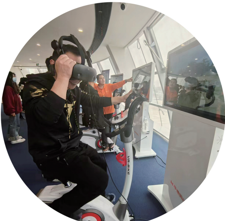
游客配戴VR眼镜体验运动游戏

“我们叫它幸福共享空间，这是一个用于心理健康服务的场所，内设心理电影院、儿童心理关爱空间、老年心理关爱空间等，还有清华社科学院的脑电实验室、脑电实验室、中医与心理的实验室、儿童认知实验室等高科技前沿实验室。”倪子君说，永宁幸福科学馆将充分利用这一心理健康服务平台，积极转化清华大学的积极心理学各项理论与科研成果，帮助更多的人认识和了解心理学，提高个人、团体乃至整个社会的心理健康水平与幸福感，助力人民拥有更加健康和幸福的生活。