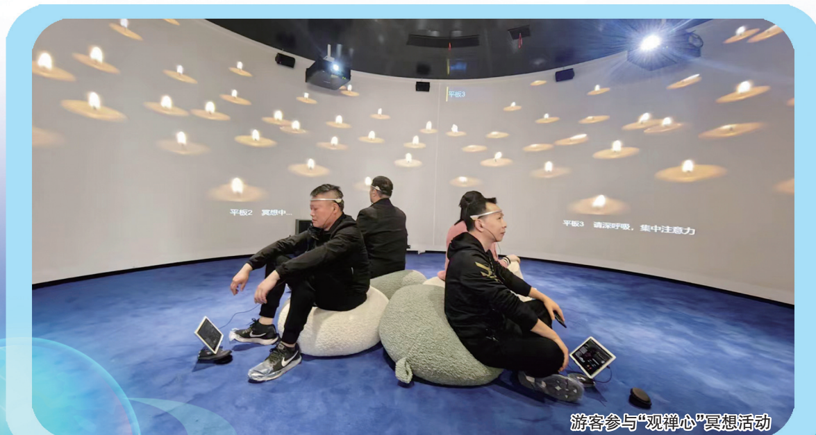
游客参与“观禅心”冥想活动