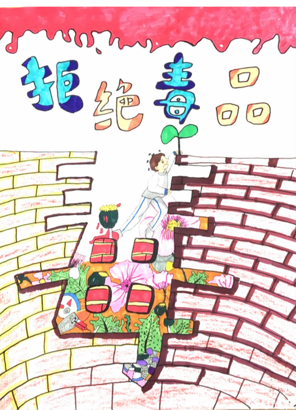
拒绝毒品 莲花中心小学 郑杨蕊