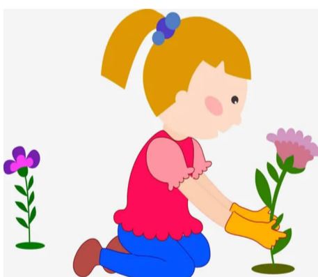
实验小学 301 班 麻蒙蒙

伤心欲绝。爷爷又告诉我，有些植物喜阴，有些喜阳，有些喜欢水，有些不能浇太多的水。看来，种花还真是一门高深的学问啊。