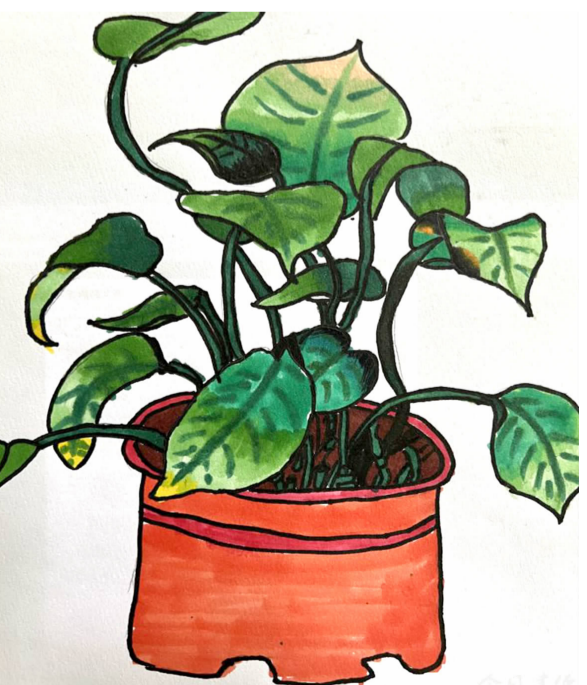
植物 明珠小学五 (5) 班 陈子问 指导老师 朱岳泉