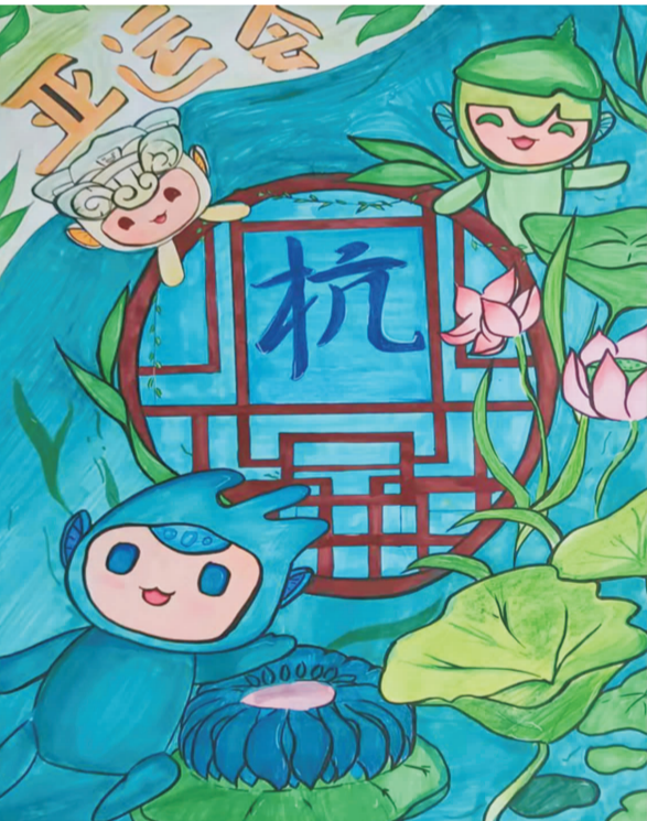
杭州杭州 梅城中心小学 601 班 蔡云菲 指导老师 洪学敏