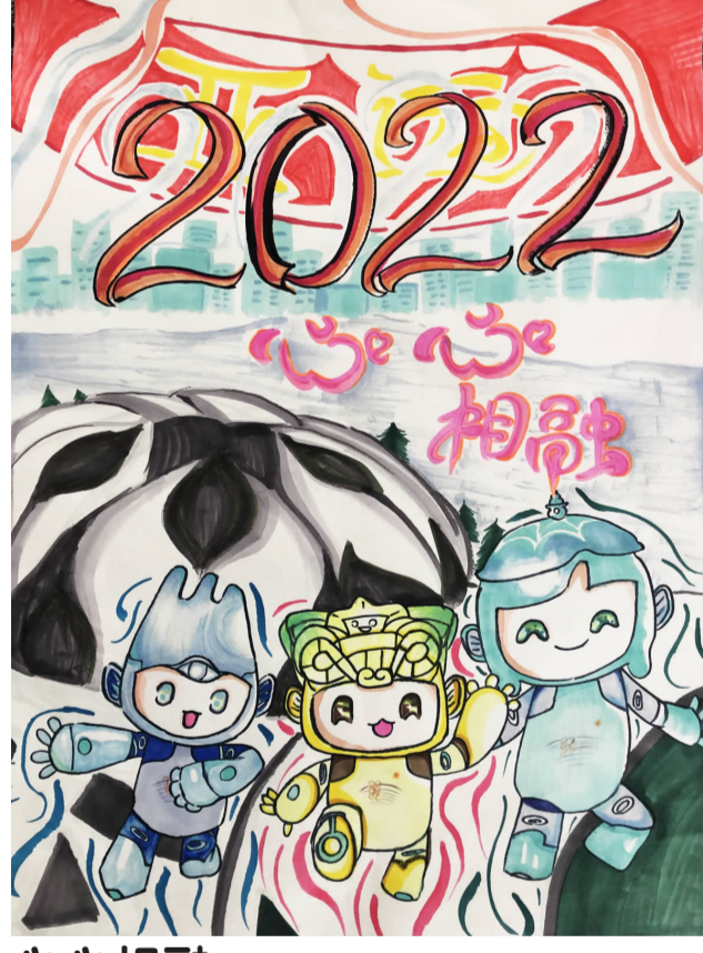
心心相融 实验小学 602 班 徐蕾 指导老师 严春