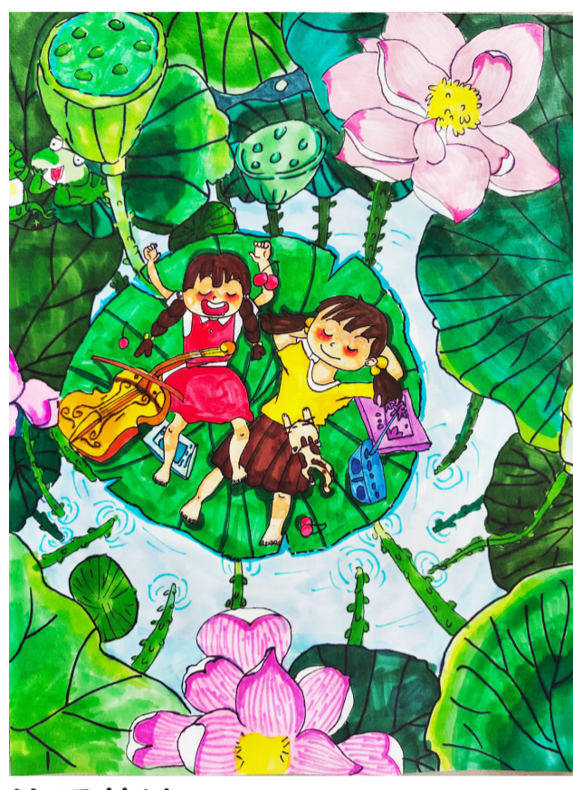
快乐荷塘 新三小三 (2) 班 徐婷婷