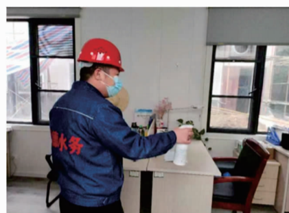
运转、污水达标处置。