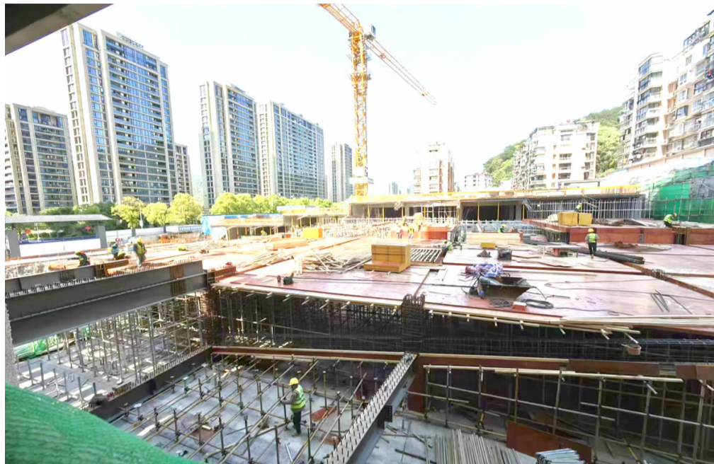
市一医院二期工程

在市城投公司各在建工地，各种工程机械来回穿梭，工人们奋战在各自岗位，焊接声、锤打声、机器轰鸣声交织成一片，奏响了项目加快建设的精彩乐章。据统计，“五一”期间，市城投公司累计完成项目投资3100万元。