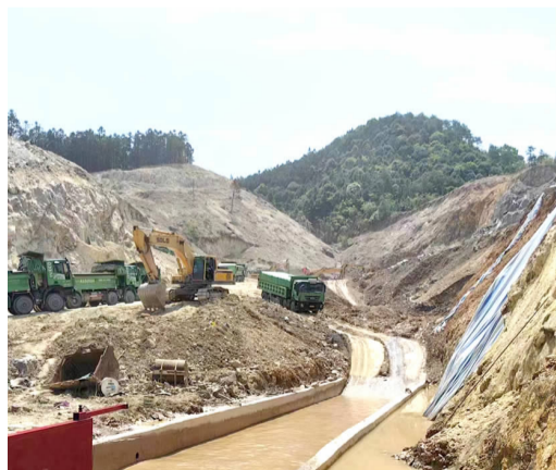
洋安初中施工现场