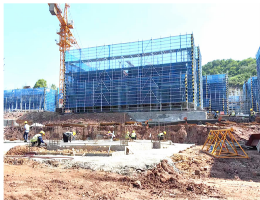
江村埠安置房工程