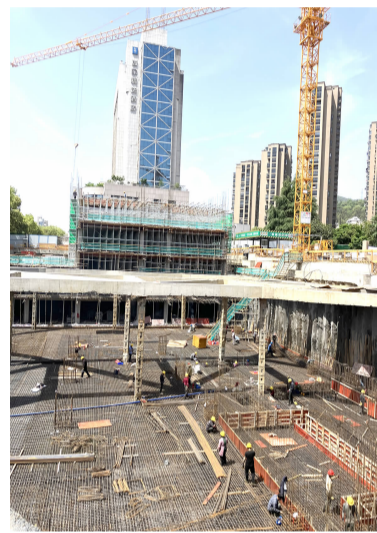
城东商务大厦项目

“五一”期间，市城投公司通过提升安全生产检查频次，强化对重点环节管控，紧抓施工围挡、用电、消防、高空作业等关