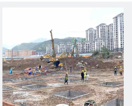
梅城安置房二期（龙溪区块）