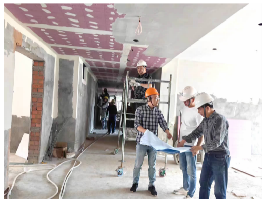
洋安幼儿园施工现场

键领域，明确安全责任，加强安全宣传，设置好安全警示标语，每日进行安全交底和安全例会等举措，确保假期施工安全，绷紧安全生产思想弦。在文明施工方面，各项目严格按照文明施工要