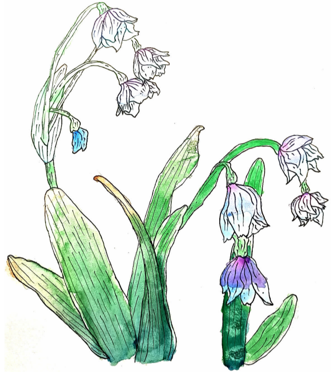
我的植物朋友 月亮湾小学三（1）班 方豪