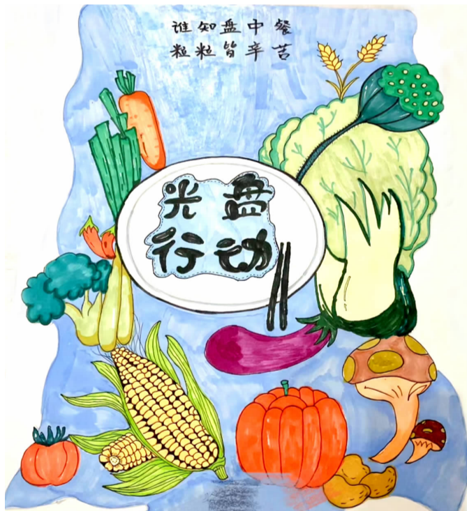
谁知盘中餐 大同一小二（1）班 张瑞雪