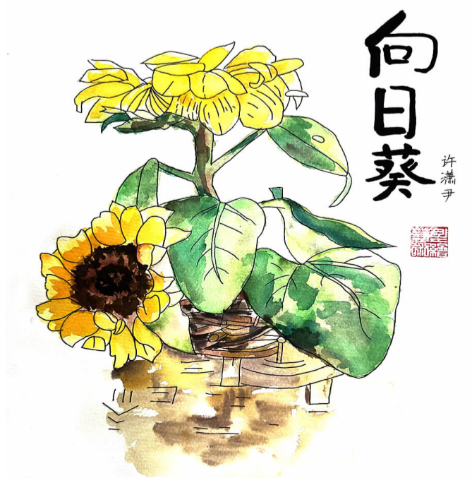
向日葵 洋溪小学五（3）班 许潇尹 指导老师 吴莹芳