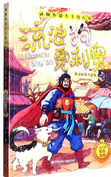
这本书的作者是著名的“动物小说大王”沈石溪，他毕业后就奔赴云南西双版纳，在那儿生活了整整三十六年。长