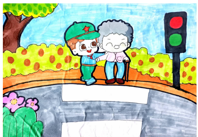
学雷锋做好事 大洋中心小学四(2)班 张珂可