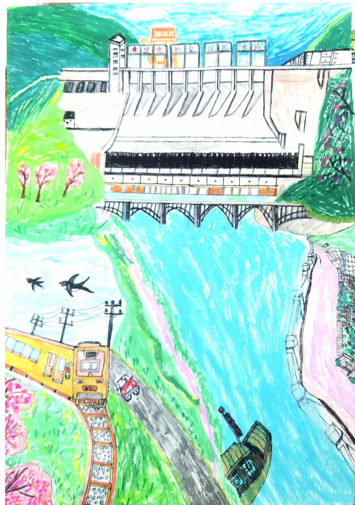
春日建德 月亮湾小学三(2)班 叶璇 指导老师 连静怡