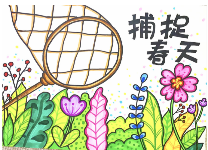
捕捉春天 大同一小三(1)班 邓子涵