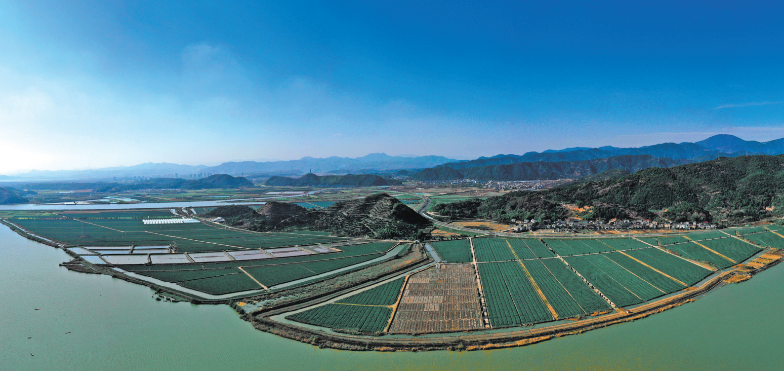
万亩田园“丰”景如画

通过农村综合改革标准化试点项目的实施,我县建立了县级督查、乡镇自查、村级监督“三级联动”的标准实施监督机制,将“36条”标准纳入村干部过关考核培训内容,实现标准普及到村入户全覆盖,不仅提高了村级事务办理效率,也提升了村级权力运行规范化水平。“乡村基层民主治理满意度达95%,对村干部规范性、公开透明度约束‘微腐败’效果满意率达100%。”县纪委监委党风政风监督室主任邱剑刚介绍,“农村村干部用权变得更加规范,与群众间的矛盾少了、信任多了,基层社会治理韧性更足了。”