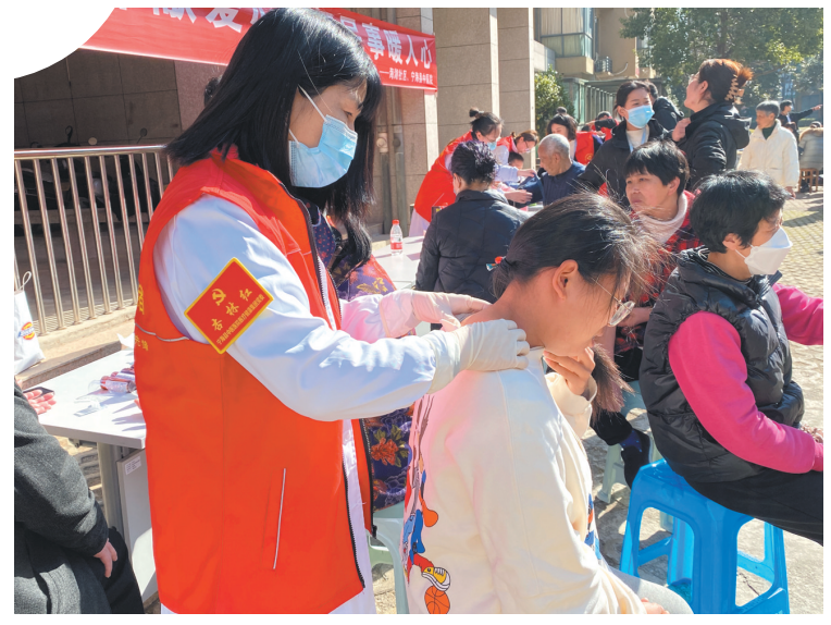
2月28日,县中医医院吉林红志愿服务队联合海湖社区党支部,在四季桃源小区开展学雷锋志愿服务活动,为社区居民提供测量血压、用药指导等服务,并对一些常见病、多发病进行答疑解惑、现场诊治。