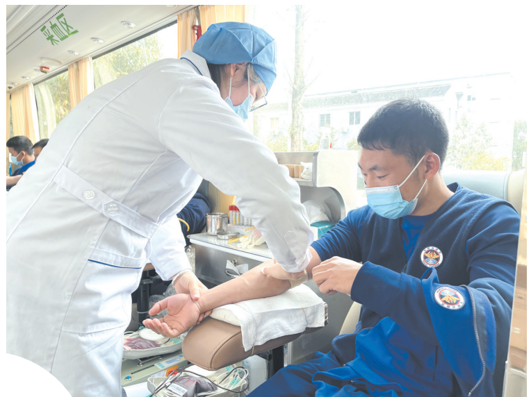
日前,力洋镇组织开展无偿献血活动,广大镇村干部和群众积极报名参加,他们中有的是首次献血,也有的是再次献血,大家用实际行动传递温暖。