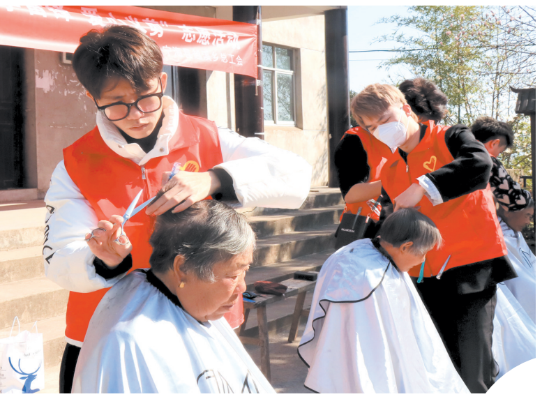
近日,越溪乡总工会组织吉美造型志愿者在王干山村开展学雷锋“爱心义剪”活动,让村民们在家门口就能享受爱心服务。