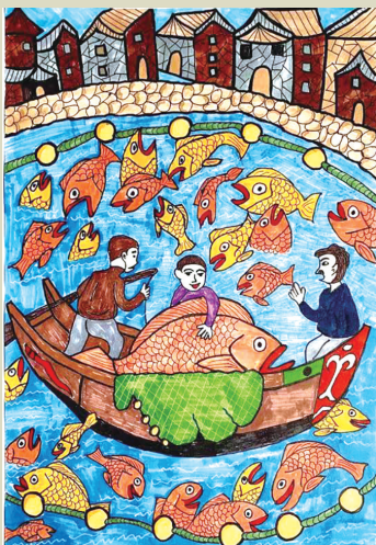
收获 西店镇中心小学四(2)班 朱丽洁