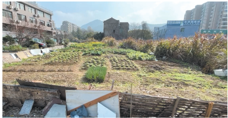
汇景嘉园小区一角

解决小区内毁绿种菜问题,不仅需要小区居民的自律,更需要相关管理部门的监管。希望街道社区在搞好绿化的同时,切实提高小区居民的环境卫生意识,营造一个舒适怡人的居住环境。