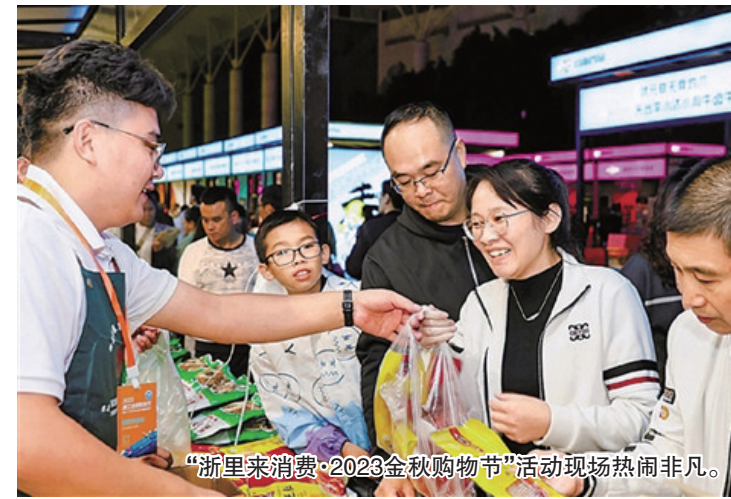
“浙里来消费·2023金秋购物节”活动现场热闹非凡。

促消费,惠民生。10月20日晚,“浙里来消费·2023金秋购物节”全省启动仪式在温州举行。