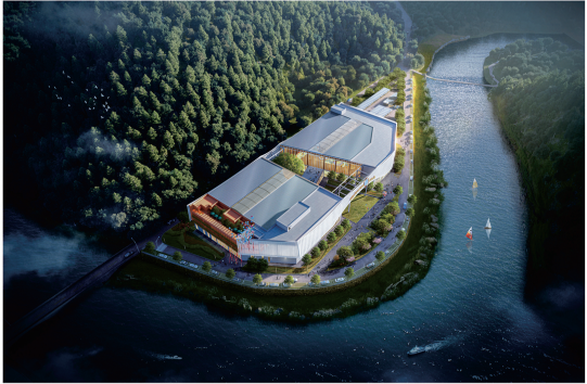
建设项目建设效果图

桐庐县新合乡壶源溪休闲旅游度假项目(游乐场)位于桐庐县新合乡新合村坑口,项目所在地用地性质为娱乐康体用地(B3),项目主要经济技术指标如下: 用地面积:12504m 2 建筑面积:13737.09m 2 (其中地上13544.49m 2 ,地下192.6m 2 ) 容积率:1.08 建筑密度:52.28% 绿地率:21.39% 建筑层数:地上3层,地下1层 机动车位:190辆(场地内74辆,场地外116辆) 非机动车位:345辆(场地内93辆,场地外252辆)