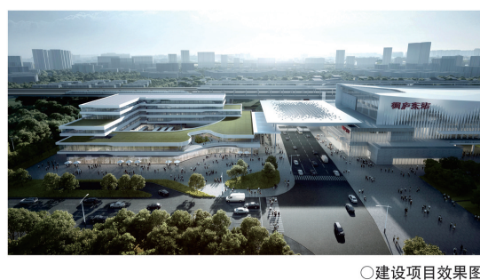
建设项目建设效果图

桐庐东站配套公交枢纽工程位于桐庐站南侧,站南路与站南路交叉口东北侧地块。项目用地性质为商业用地兼容交通枢纽用地,项目主要经济技术指标如下: 用地面积:12740m 2 建筑面积:总24312m 2 (其中地上16737m 2 ,地下7575m 2 ) 容积率:1.31 建筑密度:48.1% 绿地率:11.0% 建筑层数:地上1-5层,地下1层 机动车位:173辆 非机动车位:287辆