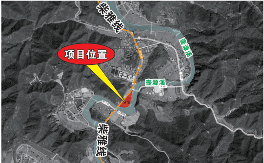
建设项目建设示意图