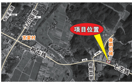
建设项目建设示意图