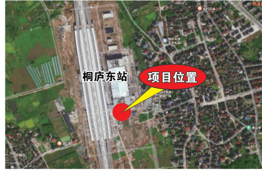
建设项目建设示意图