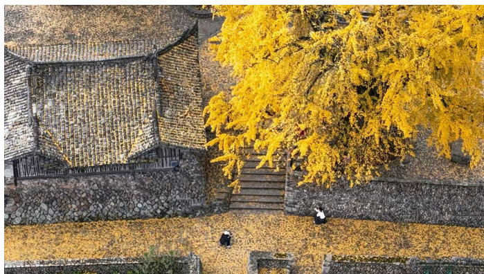
埭头古村，秋天的盛宴

11月底，一场古村古味的“楠溪晒秋”活动引爆冬季旅游，让被“冷落”许久的林坑古村再次回到大众视野高位，一度成为周边游客争相打卡的焦点。在疫情防控下，古村日人流量仍强势突破三千人，从周边农家乐到民宿一度客满为患，白萝卜、番薯条、素面等农副产品销售得一干二净……这场成本控制仅在5万元内的旅游营销何以踩中大众心理，让游客心甘情愿为其买单？