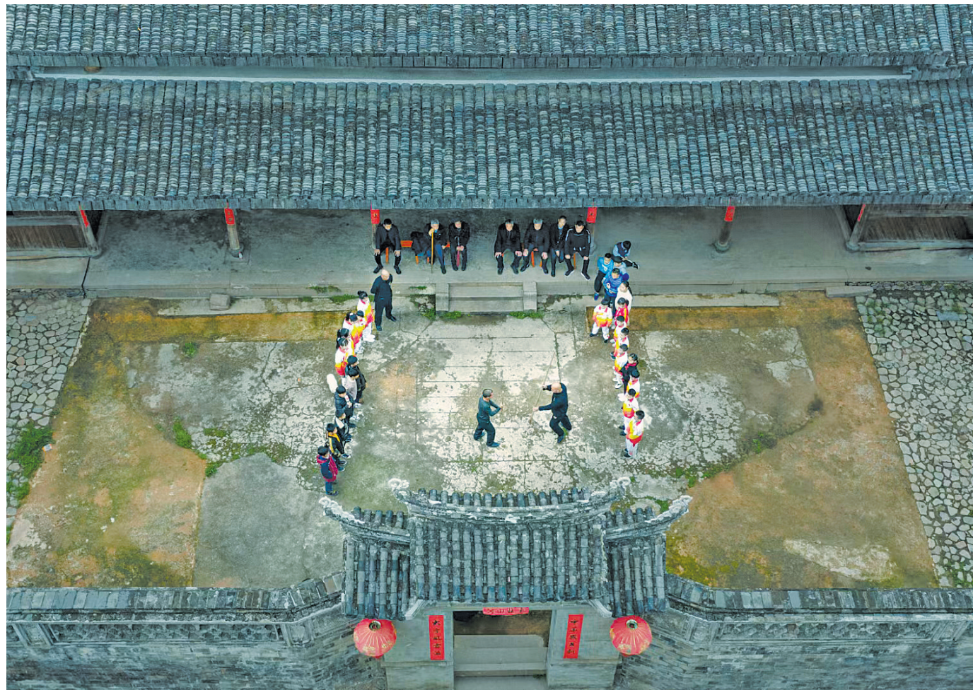
枫林古镇：武术传承