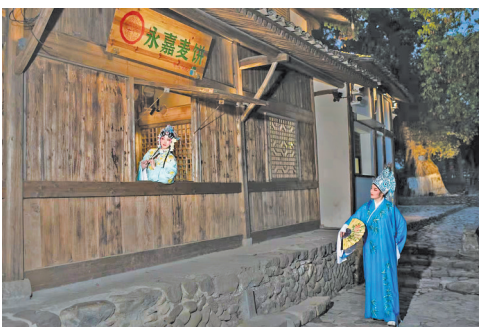
岩头丽水街：实景演出永昆《游园惊梦》