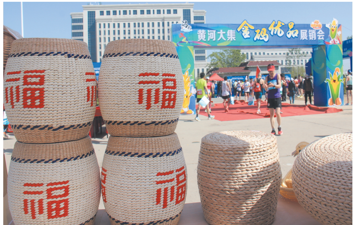
“金码优品”展示,让参赛队员了解码头文化。

为增加跑者沉浸式的体验感,赛事同步推出以“黄河大集”为主题的“金码优品”半马“展览+消费”活动。现场,队员们能体验到一场集文旅产品、农副产品、码头美食于一体的展销盛会。让参赛队员们体验到了码头文化,感受“金码大地”的无限可能,缘起一场“半马”而爱上沿黄“金码”。