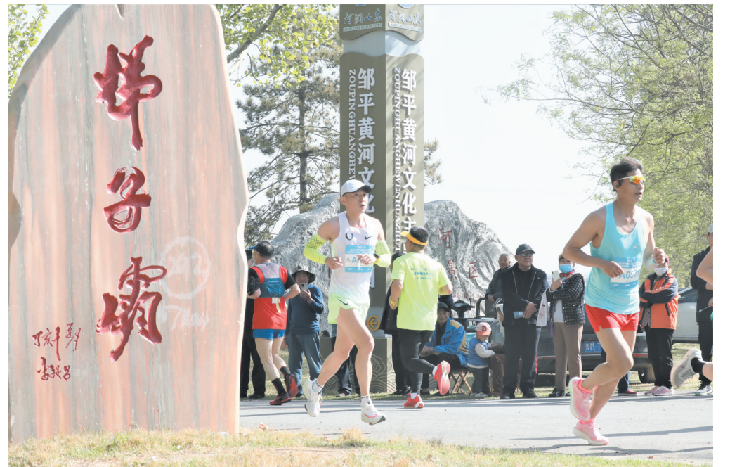
参赛队员在折返点返程。