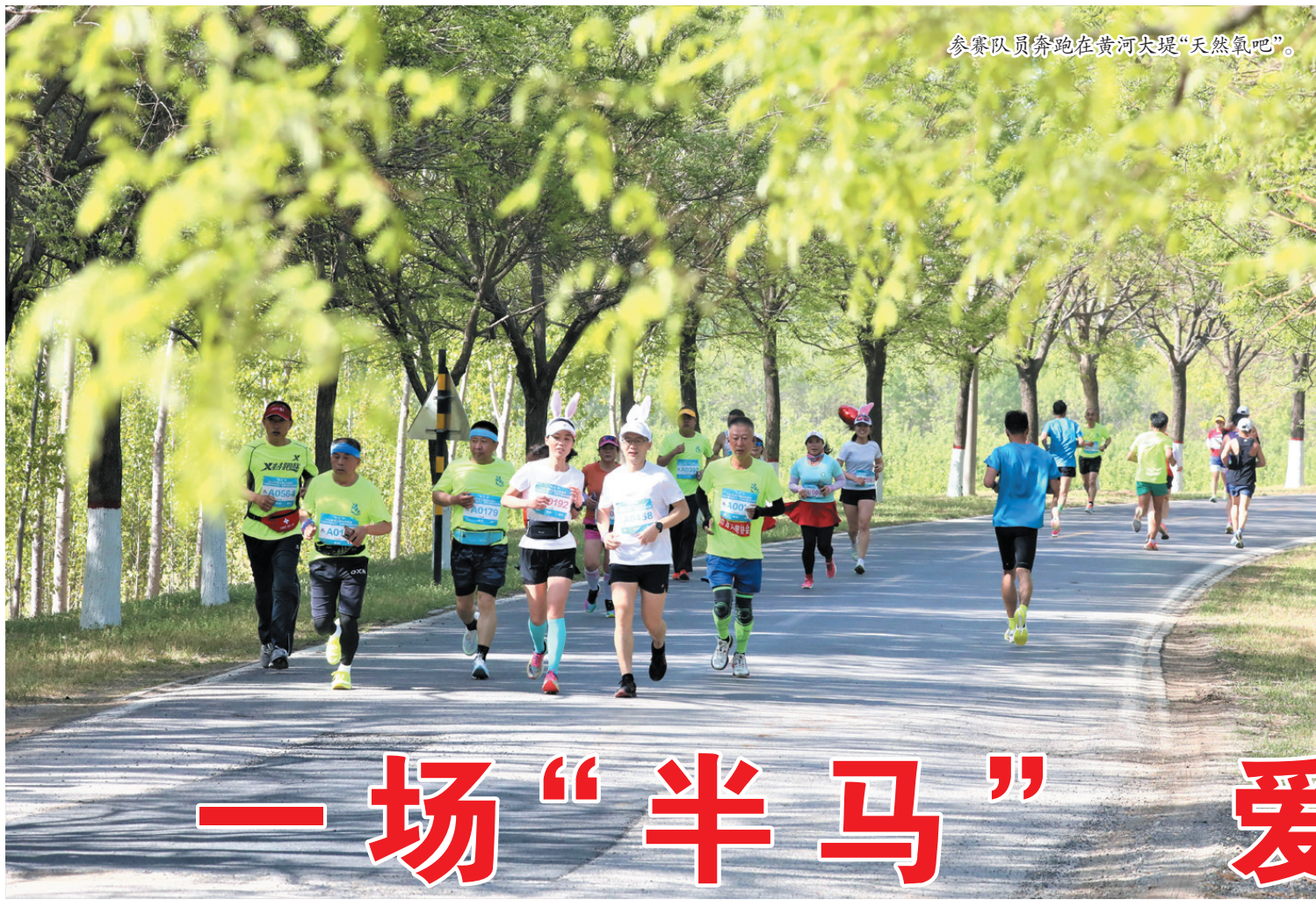
参赛队员奔跑在黄河大堤“天然氧吧”。