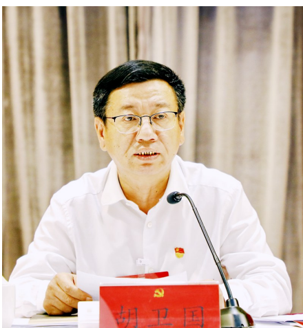
区委书记胡卫国作重要讲话

深入学习贯彻习近平总书记在庆祝中国共产党成立100周年大会上的重要讲话精神,认真贯彻落实十一届市委十一次全会精神,总结上半年工作,部署下半年任务,审议通过《中共金山区委关于贯彻十一届市委十一次全会精神加快推动转型升级全面提升金山城市软实力的实施意见》,审议并通过全会决议。