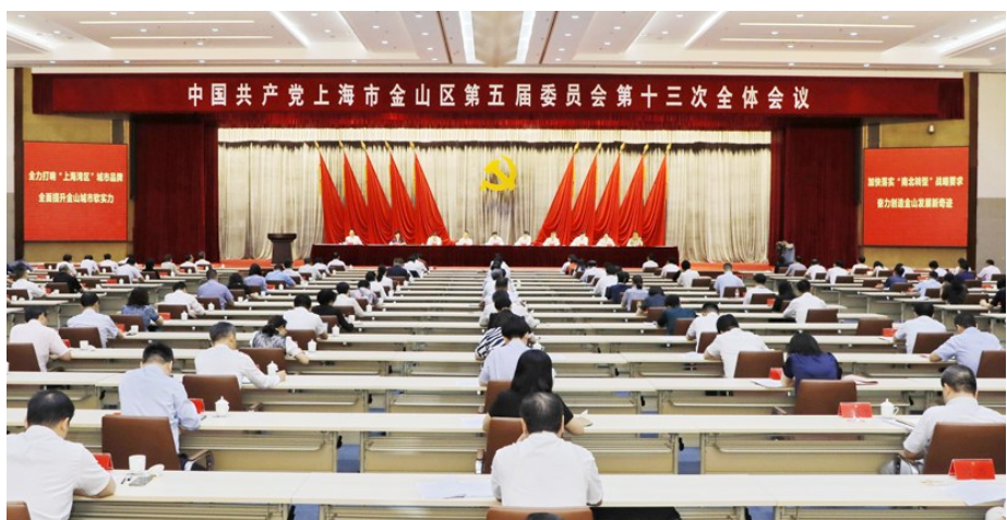
中共金山五届区委十三次全会会场

本报讯(记者 金宏 朱悦昕 林鹏鹏)7月8日,中国共产党上海市金山区第五届委员会第十三次全体会议在区会议中心隆重举行。全会以习近平新时代中国特色社会主义思想为指导,深入学习贯彻习近平总书记在庆祝中国共产党成立100周年大会上的重要讲话精神,认真贯彻落实十一届市委十一次全会精神,总结上半年工作,部署下半年任务,团结带领全区各级党组织、全体党员和广大干部群众,紧扣“南北转型”战略要求,统一思想、凝聚共识,比学赶超、谋定快动,努力推动高质量发展、创造高品质生活、实现高效能治理,深入落实“两区一堡”战略定位,全力打响“上海湾区”城市品牌,为全面提升金山城市软实力,创造新时代金山发展新奇迹而努力奋斗。全会审议通过《中共金山