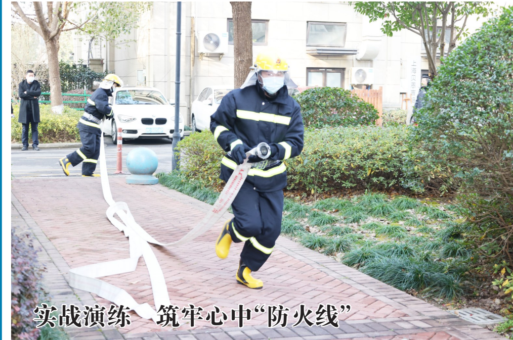
实战演练 筑牢心中“防火线” 1月11日上午,旭辉居委会与社区民警、永升物业公司在小区内开展消防演练活动。此次演练有消防安全知识讲解、现场灭火演练等环节,从如何快速规范穿戴消防服、正确使用灭火器材,灭火器的种类及不同的使用方法,水带和消防栓的连接使用等基本常识进行详细讲解。据悉,旭辉居民区每月至少进行2次消防演练,通过轮流训练的方式,全覆盖提高物业服务人员的火灾扑救能力和消防安全意识。 胡文妹/文

家成立于2008年、占地面积60亩的企业被簇拥到了“聚光灯”下,产值连年翻倍,2021年产值突破1.5亿元。 当前,上海舜锋已瞄准新材料领域,并与深圳清华大学研究院联合开展“产学研”合作,未来将开拓柔性显示屏、石墨烯、新能源电池回收等新领域产品。 在车间内,上海舜锋董事长、总经理史延锋自豪地告诉记者:“这一年多来,企业发展速度非常快,订单根本做不过来。现在,我对订单采取了‘优中选优’的策略,逐渐减少100万元以内的订单承接量,明年,企业发展会再上一个大台阶!”