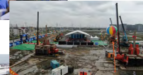
8. 华平金山智慧产业园一期竣工