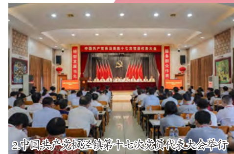
2. 中国共产党枫泾镇第十七次党员代表大会举行