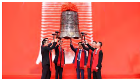
9. 太和水、读客文化成功上市