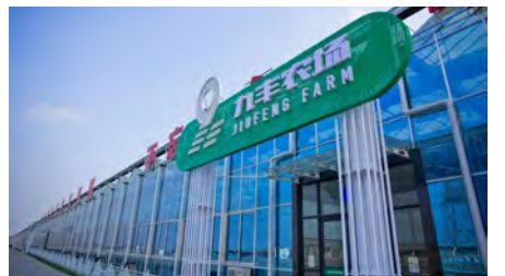
10. 农文旅新地标,枫泾九丰农场试运营