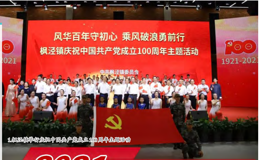
1. 枫泾镇举行庆祝中国共产党成立100周年主题活动

2021年3月18日,枫泾镇召开党建工作会议暨党史学习教育动员会。围绕现代化枫泾特色新城镇建设目标,枫泾镇领导班子成员分别认领民生项目和发展项目28个,村居班子成员分别牵头落实群众关注民生项目172个,截止目前均已全部完成。在加强“亭枫发展轴”过程中,开展了枫泾、朱泾、亭林三镇班子成员联组学习活动,串起党史学习教育的区域链。