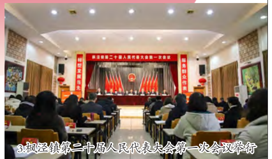
3. 枫泾镇第二十一届人民代表大会第一次会议举行