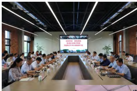
4. 扎实有序推进党史学习教育,积极践行“我为群众办实事”

2021年12月20日,枫泾新地标九丰农场正式开园。九丰农场集生产、观光、游学、康养等功能于一体,按照“园区景区化”标准建设。项目全部建成后,可解决就业岗位千余个,年可生产绿色蔬菜7500万斤,接待游客和考察团体预计达200多万人次。目前,九丰农场一期10万平方米玻璃温室项目、智能生产观光一体化项目以及设施菜田项目基本完成建设。该项目将打造成为华东地区乃至全国标杆性智慧农业博览园。