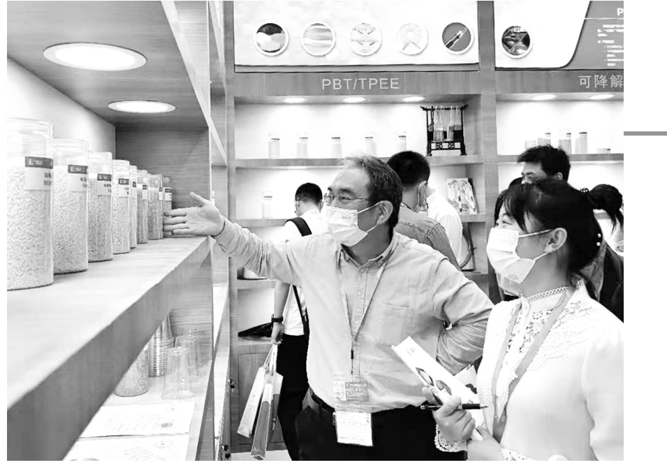
第34届中国国际塑料橡胶工业展览会日前在深圳国际会展中心举行,仅化纤公司首次携生物可降解系列新材料在展会亮相,助力橡塑行业创新材料的新突破,受到国内外客商的关注。

记者了解到,3月31日,南京雨花台区检察院召开检察队伍教育整顿征求意见座谈会,听取南京市人大代表徐毅征、石莉、符娟,市政协委员戴国强、谢国祥,特约检察室市监帮、人民监督员大江对检察工作的意见和建议。会上,来宾畅所欲言,徐毅征说,当前知识产权保护越来越严,许多企业知识产权保护意识薄弱,知识产权流失现象严重,权利人面临举证难、维权难,希望检察院能进一步完善专业化知识产权检察工作制度,保护企业健康发展。