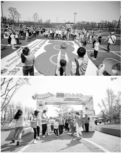
近日,锡山区云林街道总工会在云林生态体育公园举办庆祝中国共产党成立100周年“红云护航‘跃’读百年”党史学习教育暨2021年全民阅读徒步活动,吸引辖区80余组职工家庭共计300余人参与。