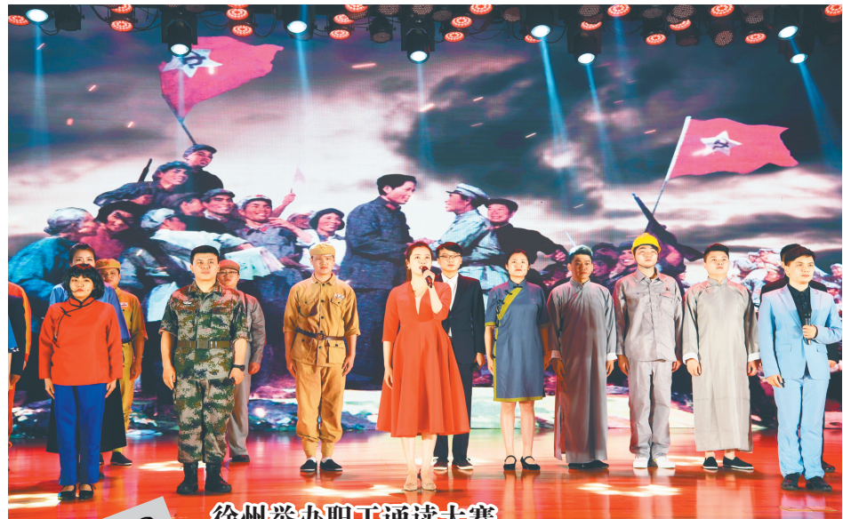
徐州举办职工诵读大赛

泰州市总党组书记、副主席耿晓利接受采访时说,本次活动是海陵区领略劳模工匠风采,弘扬劳模工匠精神的又一创新举措,也是推进党史学习教育,引领职工群众感受榜样力量,激发干事创业的民生实事。他要求海陵区充分讲好劳模故事、讲好劳动故事、讲好工匠故事,让诚实劳动、勤勉工作蔚然成风。