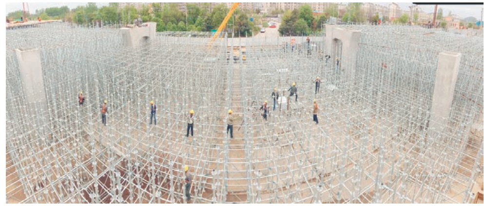
高架桥里的“蜘蛛人”