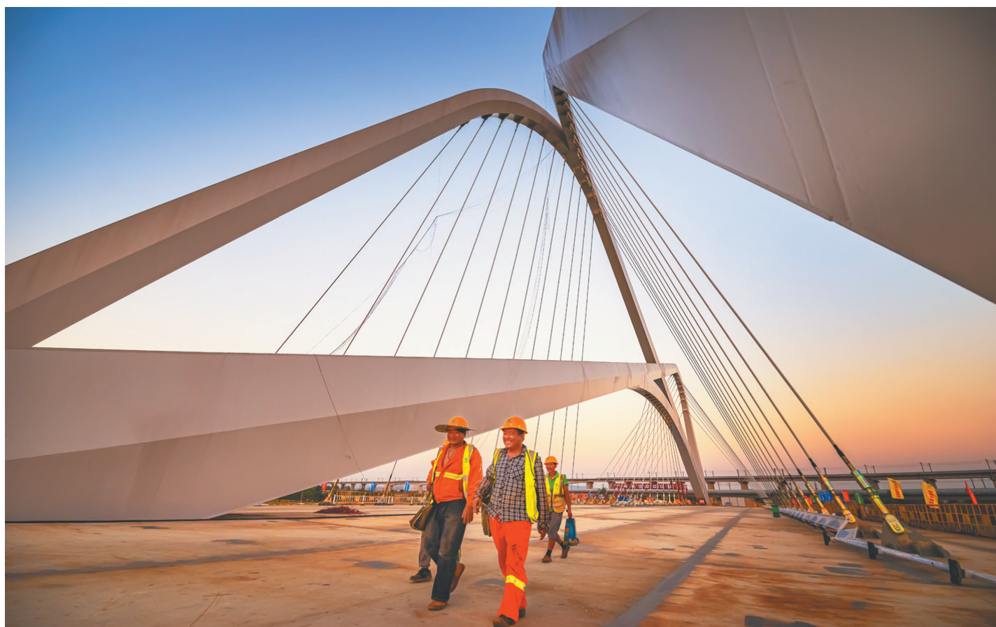
和网红桥的第一张合影