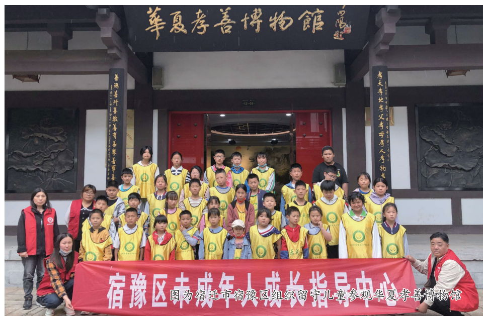
图为宿州市宿豫区组织留守儿童参观华夏孝善博物馆

未成年人健康成长事关国家和民族未来,事关千千万万家庭幸福安康。接下来,宿迁市将以此次心理健康宣传月活动为契机,把青少年心理健康教育摆在改进和深化未成年人思想道德工作的重要位置,统筹各方工作力量,强化疏管并举,不断深化未成年人心理健康教育引导,营造全社会共同关心关爱未成年人健康成长的浓厚氛围,着力培养德智体美劳全面发展的社会主义建设者和接班人。