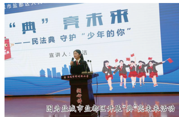
图为盐城市盐都区开展“典”亮未来活动

本报讯(通讯员 葛荣春)连日来,盐城市扎实开展“阳光润心 快乐成长”第四届未成年人心理健康教育宣传月活动,深化未成年人心理健康知识普及推广。