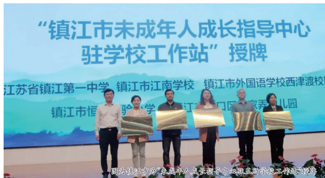
图为镇江市为“未成年人成长指导中心驻学校工作站”授牌

启动仪式以来,该市开展了系列活动,不断增强心理健康工作的针对性和实效性,努力培养德智体美劳全面发展的社会主义建设者和接班人。活动伊始,该市成立“润心”行动工作专班,召开联席会议,建立学生发展指导中心,构建学校、家庭、社会协同关爱共同体。校级层面成立由党政主要负责人牵头的“润心”行动工作专班,制订专项工作方案和应急处置预案。对重点关爱学生成立由专职心理健康教师、班主任、相关任课教师、关系较好同学和学生家长等组成的干预工作小组,科学实施危机干预。通过电话、网络、一对一帮扶等形式,提供有针对性的家庭教育指导服务,为家长育儿释疑解惑、排忧解难。 宣传月期间,该市各校广泛开展“5+N”活