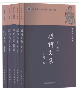
《烂柯文集》 寇永升 著 东方出版中心

全书5卷共12辑,编辑体例专业、完备,其中学术专业类文章占比不多,凸显了文集的个人特色和风格。文集中也收录了一些同事、同行和学生的文章,不仅与永升兄个人所述互为呼应、互为补充、互为印证,也能更好地凸显文集的纪念意义。